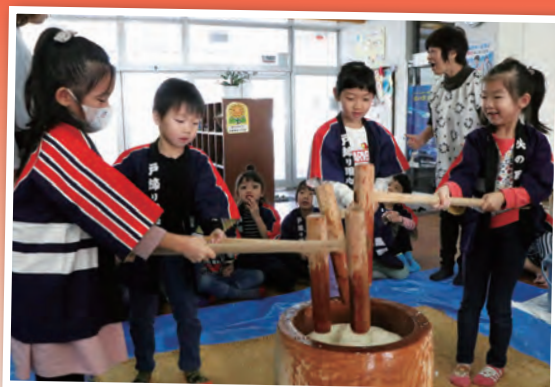
もちつき会 (12月11日、音杉保育園)