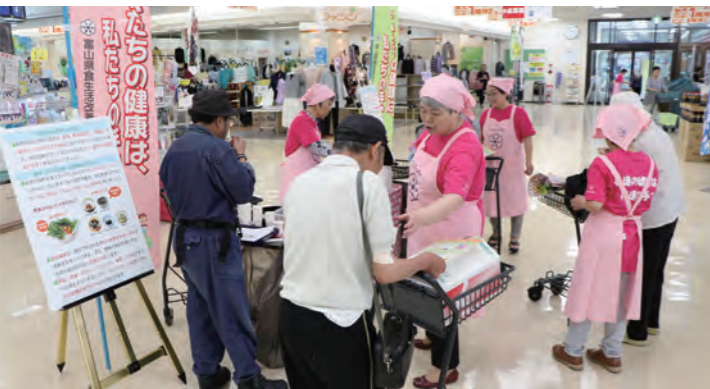
▲上市町食生活改善推進協議会の皆さんが食品ロス削減レシピの試食会を行いました。（令和元年6月19日、上市ショッピングタウン）

食品ロスは、食品の生産から消費までの各過程において発生しており、削減するためには幅広い関係者の理解と協力が必要です。食べ物への敬意・感謝の気持ちを大切に、皆さん一人ひとりが意識を変えて、削減のためにできることから始めましょう。