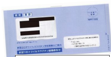
クーポン券が入った封書