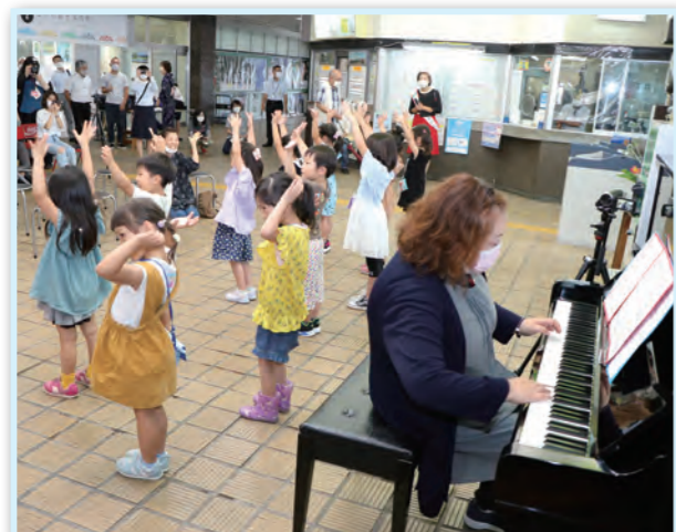
▲伴奏に合わせて歌う園児たち

ピアノは、午前9時から午後5時まで一般開放されており、誰でも利用できます。多い日には10人ほどが演奏しているとのこと。