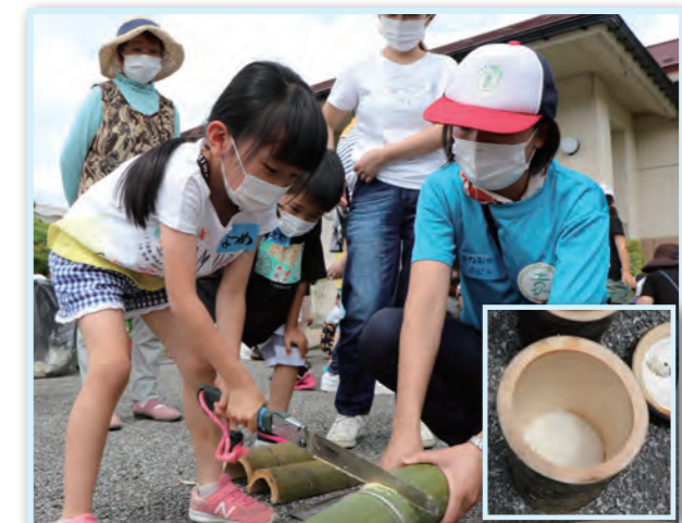
炊きあがったご飯▲

6月20日、柿沢公民館で地域の子供たちにアウトドアの技術を伝えようと、竹でご飯を炊く体験イベントが開催されました。この日は、親子で51人が参加し、ご飯を炊くための竹をのこぎりで切ったり、まいぎり式の火起こし器で火を起すなどして、炭を入れた一斗缶の中でご飯が炊きあがりました。竹で炊いたご飯は、公民館の料理教室に通う皆さんが釜で炊いたご飯と一緒にお弁当に盛り付け、参加者はそのお弁当を持ち帰り、食べ比べをすることができました。