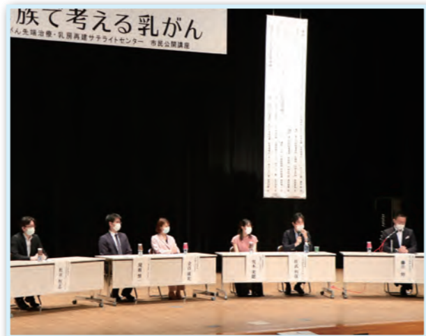
▲パネルディスカッションの様

なお、この模様は、ケーブルテレビNet3番組「Net3ワイド」にて9月13日～19日放送予定ですので是非ご覧ください。