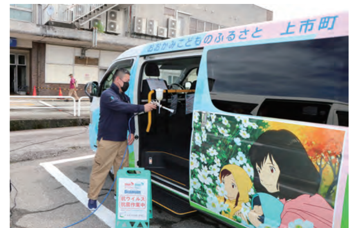
▼コーティング施行の様子

手洗いやアルコールなどの消毒と組み合わせることで、より安心して乗車できますので、これまでと変わらず皆様のご協力をお願いします。