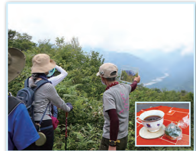
振舞われたコーヒーとお菓子▲