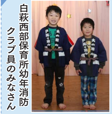
白萩西部保育所幼年消防クラブ員のみなさん