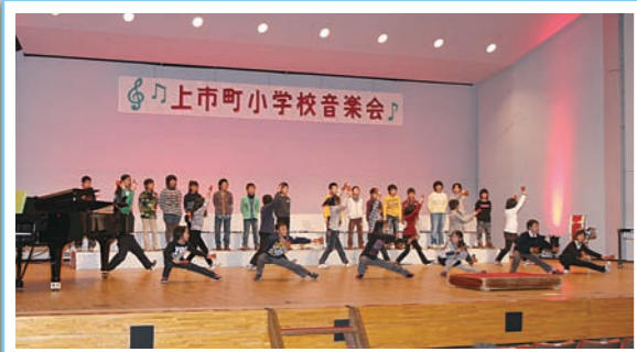
▲ ソーラン節を披露する南加積小学校4年生