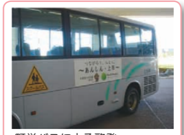
町営バスによる啓発

また、心の健康セミナーや街頭キャンペーンを実施するほか、町職員をはじめ、各地区区長、民生・児童委員、健康づくりボランティア、保健委員、ケアマネジャー、セミナー参加者にゲートキーパー手帳を配布し、活用をお願いしているところです。