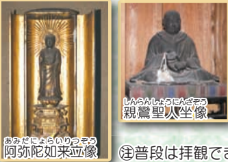
④ 普段は拝観できません。

お寺所蔵の「阿弥陀如来立像」「親鸞聖人坐像」は、ともに町の文化財に指定されています。