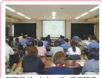
町職員ゲートキーパー養成研修