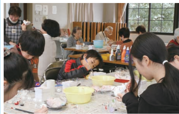
▲ 土鈴の絵付けに挑戦する子どもたち