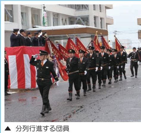
▲ 分列行進する団員