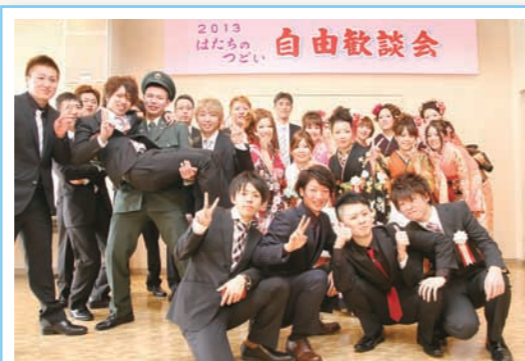
▲ 歓談会で恩師と記念撮影する新成人

この模様を収めた「はたちの写真展」を役場1階ロビーで2月21日(木)まで開催しています(写真の申込みも受け付けています)。