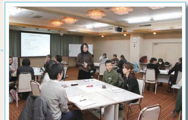
▲ 男女の違いについてグループ討議する参加者

1月26日には、応用編として男女の価値観の違いを生かした販売方法なども学びました。