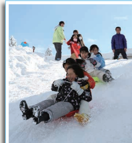
▲ ソリ遊びをする子どもたち