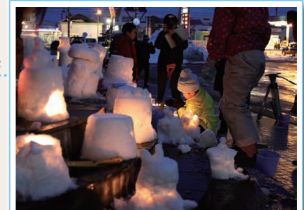
▲ 冬空を彩る雪灯籠

雪灯籠は、雪を固めて灯籠の形にし、横穴をあけて、そのなかにろうそくを立て灯をともしもので、できた雪灯籠に一齐に灯をともし、幻想的な光に包まれました。