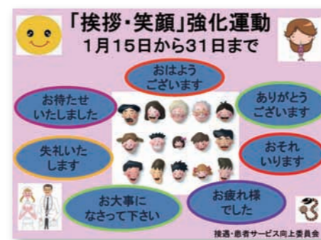
あいさつ・笑顔強化運動のリーフレット

ナイトスクールでは、「外来受付の対応に不満がある」「看護師に笑顔がない」等貴重な意見をいただきました。当院では患者満足度を向上させるべく、接遇・患者サービス向上委員会の設置や、外来・入院患者満足度調査を毎年行い、患者さんからのご意見を接遇に反映させるなど、いろいろ取り組んでいます。 「外来受付の対応に不満がある」とのご意見を受け、昨年10月に外部から講師を招き委託・派遣職員を含めた全職員を対象にした「接遇・コミュニケーション研修」を行い、職員83名が接遇について学びました。 昨年1月から診察開始前に各外来受付前や正面玄関で朝のあいさつを実施しています。また、「看護師に笑顔がない」とのご意見を受け、昨年7月に看護職員対象の接遇研修「病院における接遇の基本」を行いました。 年度初めには看護職員から