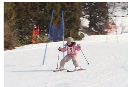
▲ ゴールを目指す選手