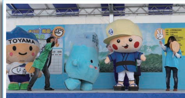
▲ じゃんけんゲームをする「とみたん」と魚津市の「ミラたん」

今年は、県内のご当地きゃらのナンバー1を決める「ご当地きゃらグランプリ2013in上市」が行われ、事前投票で上位5位に入ったご当地きゃらがじゃんけんなどのゲームのボーナス点と当日来場者による決選投票で争い、総合1位には富山信用金庫の「とみたん」が輝きました。