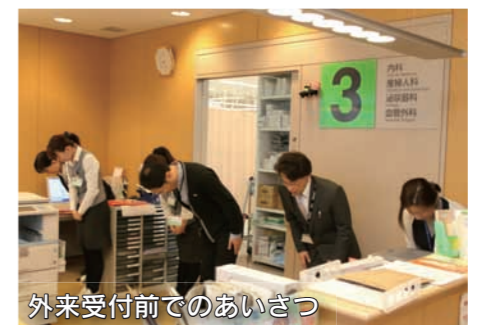
外来受付前でのあいさつ

募集した接遇標語の優秀作を月替わりでリーフレットにして、職場内に掲示し、注意啓発をしています。また、看護職の部署で毎月接遇ラウンドと接遇自己チェックを行い、継続して接遇に対する意識を高められるように努めています。 職員提案型業務改善研修の中で、職員間で患者さんへのあいさつ・会釈が不足していると感じ、1月15日から31日までリーフレットを各職場内に掲示するなど、あいさつ・笑顔強化運動を行いました。