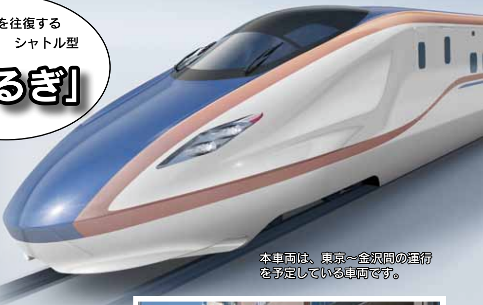
本車両は、東京～金沢間の運行を予定している車両です。

10月10日、2015年3月に金沢まで開業する北陸新幹線の列車名が、JR東日本、西日本により発表されました。主要駅のみ停車する速達型は「かがやき」、停車駅が多い停車型は「はくたか」、富山と金沢間を往復するシャトル型は「つるぎ」となりました。