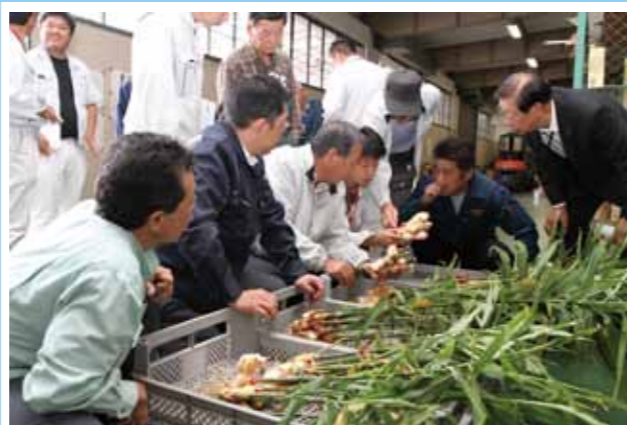
▲ 上市町産の新ショウガの出来を確かめる関係者

この目揃い会は、里芋に続く特産品に育てようと、今年初めて大岩、柿沢、白萩西部の3地区合同で開催されました。今年48生産者が2~3ヘクタールで作付けし、6~7トンの出荷を見込んでおり、11月末まで収穫されます。