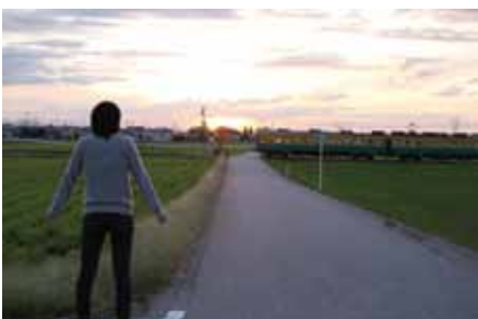
若杉地内から見る電車と夕日