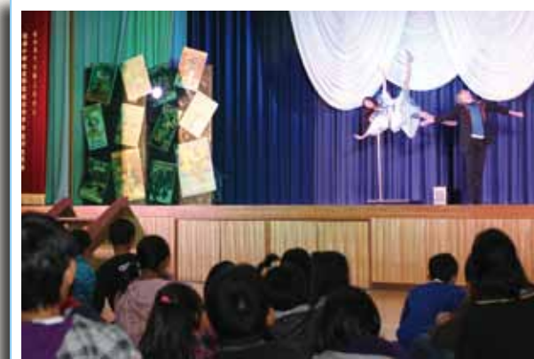
▲ 浮揚マジックを披露するプロマジシャン