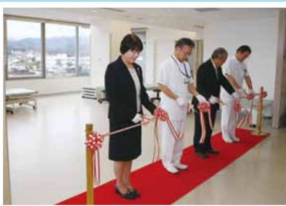
▲ テープカットする関係者