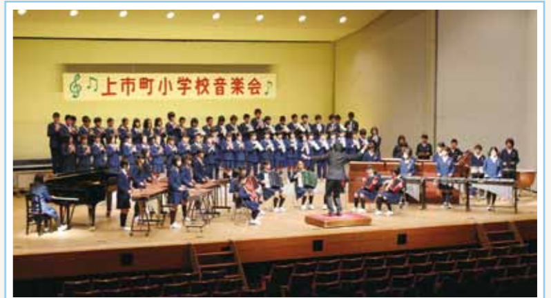
▲ 上市中央小学校6年生の演奏

発表は、上市中央小学校6年生の「with you」で幕を開け、宮川小学校3年生、白萩西部小学校3~6年生、陽南小学校全児童、相ノ木小学校6年生、南加積小学校4年生の順で発表しました。