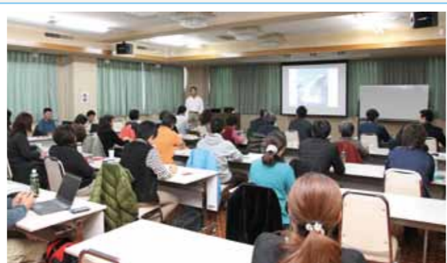
▲ プロガイドからエコツーリズムについて学ぶ参加者

講師からエコツーリズムの課題や、取り巻く環境、知床や軽井沢などのエコツアー商品の事例などが紹介されたほか、地域内・地域間連携の必要性についても説明を受けました。