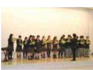
▲上市高校合唱同好会の発表

編集後記 11月16日、今年の最後となる市姫さんに行ってきました。イベントでは、恒例となった上市高校生の野菜販売の他、カミール4階では、書道部、演劇部、ダンス部、合唱同好会のステージ、2階では、おもしろ理科工作など上市高校生が大活躍。そのほか、常楽園3Gバンドの演奏、ウエルネススポーツセンターの教室に通う子どもたちの跳び箱や体操の発表、相ノ木小学校の子どもたちのけん玉の見事な技の披露など…。年齢も立場も違う人たちが一つのイベントを盛り上げようと一緒にかまくら作りに奮闘して下さった。商工会女性部さんの焼きそばもおいしかったです。来年もまた行きたいと思えます。村上