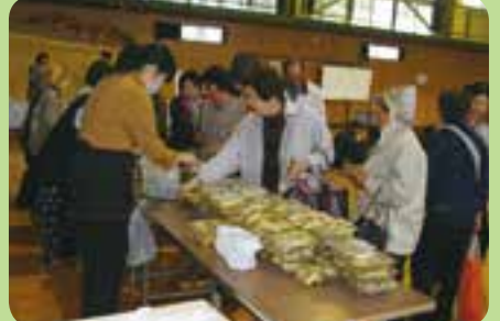
町内外から大勢の人が山の幸を求めて来られます