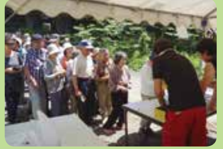
食券売り場も長蛇の列