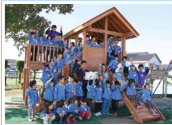
▲ 完成した遊具の前で記念撮影

この事業は、木のやさしさや、県産材の利用と森づくりのつながりについて理解を深めてもらおうと、県が行っているもので、園児と先生と一緒に考えたという赤い屋根やウォールクライミングのあるすばらしい夢のお城ができあがりました。