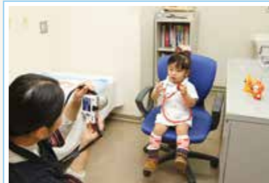
▲ 看護師になりきってハイ、ポーズ！ (ちびっこ白衣試着)