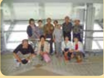
新湊大橋歩行者専用道路で記念撮影