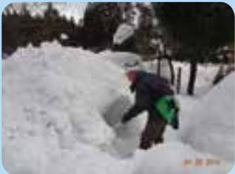
村のお父さんたちが、かまくら作りに奮闘中です!