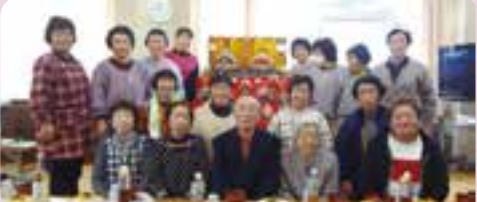
おひなさまの前で記念撮影