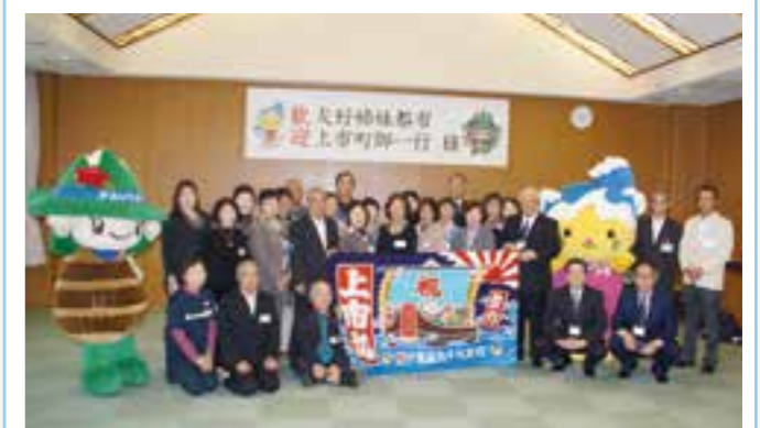
▲ 贈られた大漁旗を手に記念撮影する両町関係者

まつりでは、つるぎくん体操を披露したほか、サトイモ鍋やサトイモを振る舞うなど、上市町をPRしてきました。また、九十九里町からは、お祝い時に贈られることが多い大漁旗(上市丸と書かれた)が贈られました。