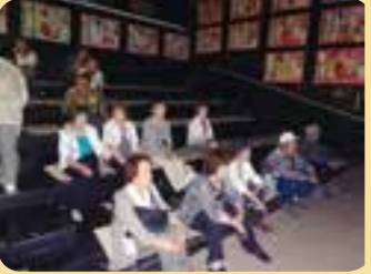
ひみ獅子舞ミュージアム(氷見市)で獅子舞シアターを鑑賞