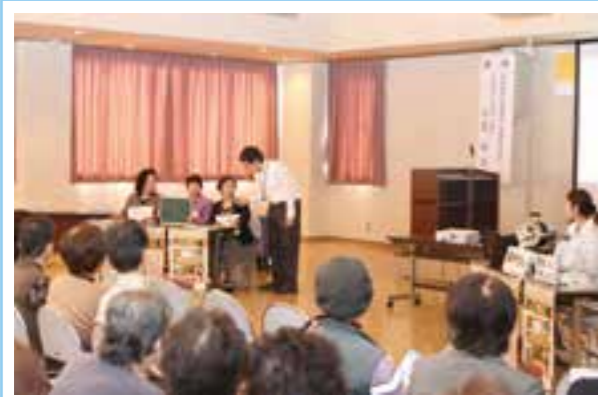
▲ “安全・安心” 出前講座