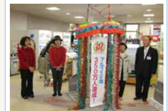
▲ 350万人達成を祝うくす玉