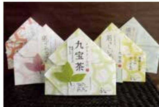
「メグスリノキの九宝茶」シリーズ