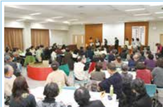
▲ 寸劇を交えた事例紹介