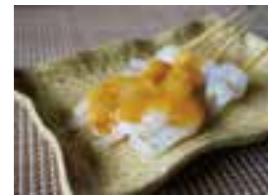
昔なじみの「あんばやし」