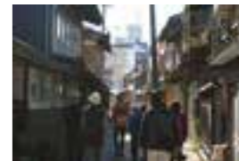
上市の街なかを歩く

現在、ツアーは販売を開始しております。お申し込みは、090-3296-3677(ツアーデスク)、または、上市町観光協会HPまで。