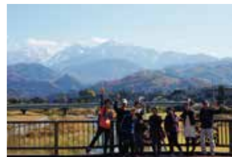
白竜橋の上で剱岳をバックに記念撮影