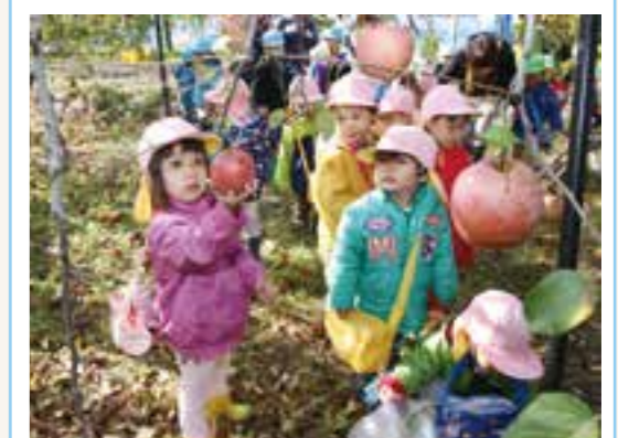
▲ りんごをもぎ取る園児