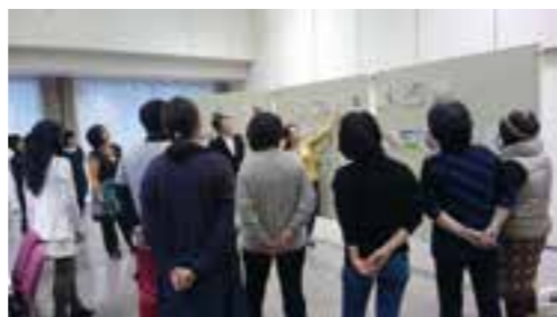
受講者の作品をそれぞれ発表