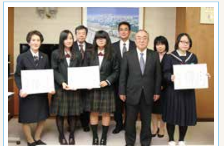
▲ 賞状を手にする受賞者の皆さんと伊東町長

部活で練習してきた多くの楽曲を、各種福祉施設で披露することにより、老人や障害者の方々への効果的な慰問となっており、地域の福祉環境の向上に寄与されています。