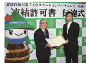
▲ 連結許可書 伝達式

上市スマートインターチェンジ(仮称・上市SIC)の北陸自動車道への連結が国から認可され、6月13日に連結許可書の伝達式が行われました。 今後、地元をはじめ関係者に十分ご理解をいただきながら、中日本高速道路(株)や富山県等との協議を進め、円滑な事業の推進を図ります。 これまでの経緯 昨年6月に国直轄支援の「準備段階調査箇所」に選定され、それ以降、国・県・町等の道路関係機関で構成された「準備会」により、設置場所や整備効果の調査・検討が続けてきました。 5月24日に国、県、中日本高速道路(株)、地元自治会代表、産業界代表等の関係者により構成された上市SIC地区協議会が開催され、実施計画について協議し、出席者から計画案の承認が得られました。