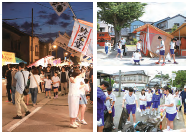
▲夜の賑わいの後は、早朝清掃活動

6月8日から10日まで、毎年恒例の市姫神社祭礼が開催され、子どもみこしや多くの屋台で賑わいました。10日早朝、「地域のために役に立ちたい」と立ち上がった上市中学校の生徒354人と教職員、保護司会、上市中央小学校ボランティア委員の児童等が祭り会場周辺の清掃活動を行いました。