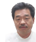
かみいち総合病院 耳鼻咽喉科部長

治療は、胃酸を低下させるプロトン阻害薬の内服が主体になります。予防策として、生活習慣病の原因になる高脂肪食やタバコ・アルコールを控えることや、猫背などの姿勢を正す、食後すぐに横になることや就寝前の食事を控えることが有効です。