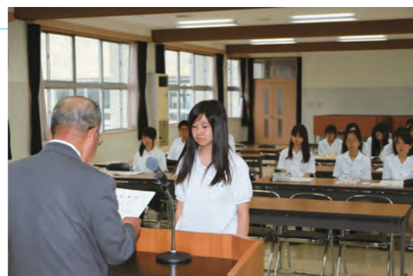
▲ティーンボランティアサポーター委嘱式

上市町社会福祉協議会によるティーンボランティアサポーター委嘱式が上市高校で行われ、意欲溢れる上市高校の生徒41人に委嘱状を手渡しました。今後、町社会福祉協議会と連携をとりながら地域で様々なボランティアや福祉活動に取り組めます。期間は1年間。