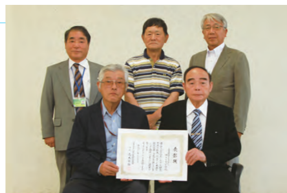
▲上市町観光ボランティアガイドのみなさん

上市町観光ボランティアガイド「剣・きらめきの会」が(公社)富山県観光連盟の観光事業振興功労者表彰を受賞しました。会を創設して11年目。観光案内の他、町内の小学生が郷土の歴史や自然について学ぶ「ふるさと学習」や町の職員研修にもガイドの協力をしています。団体、個人、どなたでも対象。ガイドの申込やお問い合わせは、上市町観光協会 ☎ 472-1515 まで。