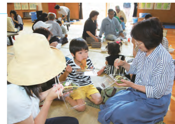
▲山菜入りのどんどん焼きや煮しめを味わう来場者

白萩南部地区の「つるぎ山菜まつり」が白萩南部小学校周辺で開かれ、町内外から山の幸を求めて訪れた大勢の人で賑わいました。白萩南部公民館と同地区社会福祉協議会が毎年開催し、今年で27回目。ウドやエラ、ヨシナなど5種類をパックに詰めた煮しめ、フキノトウやタラの芽の天ぷら、くま鍋、イワナ、山菜入りのどんどん焼きなどが販売されたほか、アルプス民謡会が歌や踊りを披露しました。