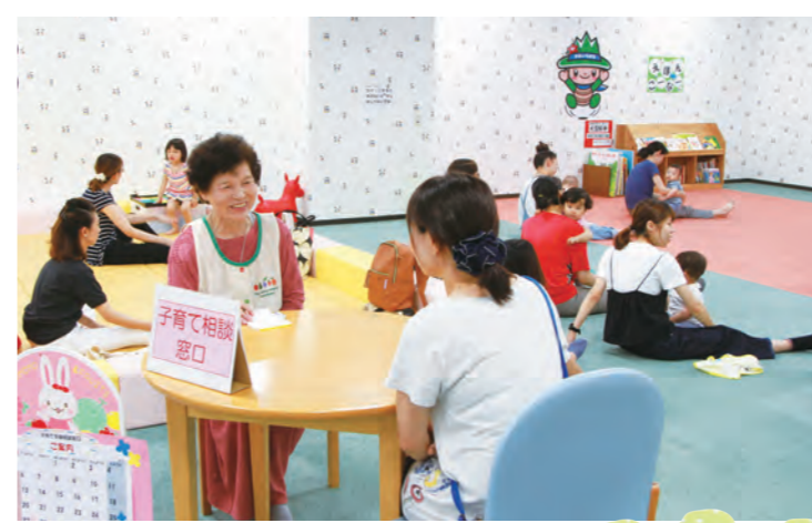
▲ 子どもの悩みを話す保護者