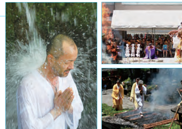
▲ 護摩祈祷・火渡り・滝修行の様子

県内外から訪れた大勢の人達が見守る中、護摩祈祷が行われ、僧侶は弓や太刀で邪気を払い、読経を唱えながら護摩壇を燃やしました。僧侶や信者、一般参加者が、素足で燃やした護摩壇の木の上を渡る火渡りや滝修行を行い、五穀豊穡や無病息災を祈願しました。