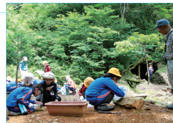
▲ 金鉱石探しに夢中の児童

児童は、早月川に架かる長さ約130mのつり橋を渡り、山道を10分ほど登って現地に到着。金山の歴史を聞いた後、奥行き約130m、幅約1m、高さ1.4~2mの坑道に入り、採掘当時の様子を体感しました。