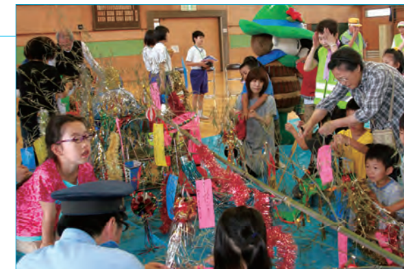
▲ 願いを書いた短冊を竹に飾りつける児童たち

児童たちは、防犯の誓いや将来の夢などを書き込んだ短冊を地域の方たちと一緒に竹に飾りつけた後、みんなで元気よく「七夕」を合唱しました。