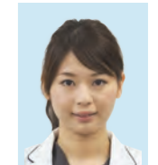
かみいち総合病院 内科医員

る嚥下リハビリテーションでは、頬・口唇・舌の体操や訓練、口腔ケアなどを行います。内容を知り、コツさえ掴めば自宅でも実行可能です。 嚥下障害を疑ったらぜひ主治医に相談して下さい。検査を行い早期に診断介入することが、重篤な誤嚥性肺炎の予防に繋がります。