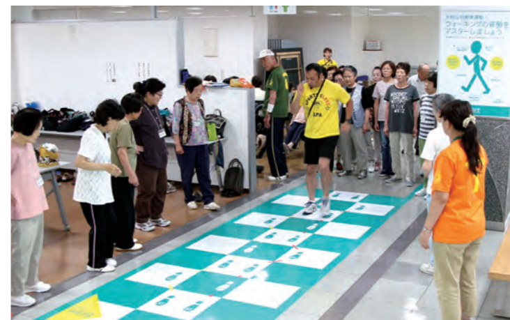
▲ 定期的に開催される介護予防教室でウォーキングする参加者