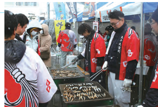
▲ 九十九里町の名物商品「いわしの丸干し」

今回、姉妹都市九十九里町から町職員など25名が参加して出店したブースでは、九十九里町の名物商品「焼きハマグリ」「いわしの丸干し」などを販売。町の福祉事業に役立ててと収益を上市町に寄贈されました。