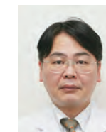
かみいち総合病院 外科部長

がんは、日本人の死因で最も多い病気であり、現在2人に1人ががんになり、3人に1人ががんで亡くなっています。患者さんは、がん自体や治療に関連する痛み、倦怠感などの身体的な症状、落ち込み、悲しみなどの精神的な苦痛や生活面での不安などを経験されています。それら様々な患者さんやご家族の「困っていること」をケア、サポートすることが緩和ケアであり、がんが診断を受けた時や治療の初期から受けることができます。