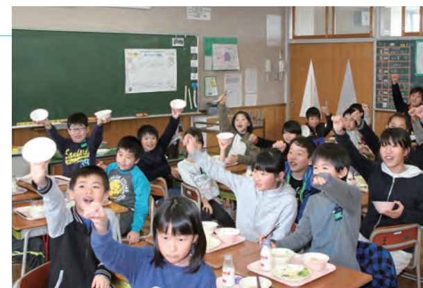
▲ 14日は「大豆とじゃこの混ぜご飯」 相ノ木小学校4年生が全員「食べきったゾウ！」

この取組みを通じて、子どもたちが食べものに感謝し、大切にいただく気持ちを養いました。