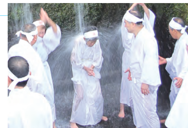
▲ 滝に打たれて修行する信者たち

午前8時、厳粛な空気に包まれる会場の気温は0℃、水温0.4℃と厳しい寒さの中、白装束に身を包んだ信者は般若心経を唱え、ほら貝の音を鳴り響かせる中、順々に滝に身を置きました。