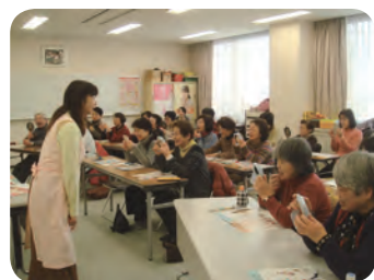
↑歯周疾患予防教室で歯のチェックをする参加者

今回は1月18日に開催した歯周疾患予防教室より、むし歯や歯周病について、また効果的なブラッシング方法についてお伝えします。