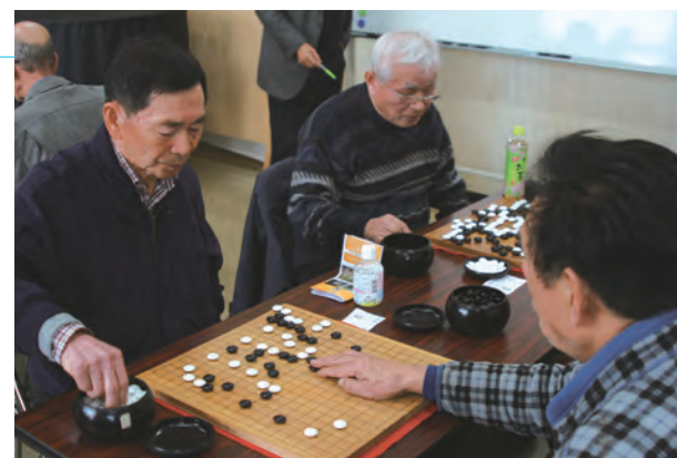
▲ 碁石の音が鳴り響く会場