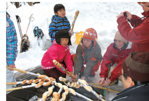
▲ 竹棒の先にパン生地を巻き、炭火で焼く参加者

また、近くの民家で冬の里山の暮らしぶりを教わった後、公民館へ戻って炭火でパンを焼き、シチューと一緒に味わいました。