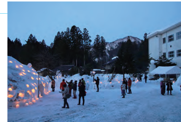
▲ 巨大かまくらの灯火に見入る参加者

翌日は、雪遊びやピザ作り体験の他、町総合スポーツクラブの「かんじきハイク」も開催。お昼には地元住民が山菜料理などをふるまい、参加者は山の幸を味わいながら冬の里山で親睦を深めました。