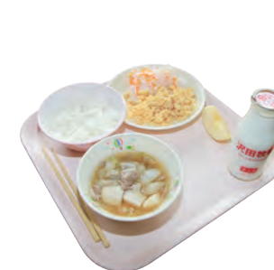
↑116品の食材の内、14品が上市産

工夫されたメニューの他、生産から出荷までを体験学習で学び、生産者との交流会食をして特産品の認識を深めている点などが評価されての受賞となりました。 平成24年度までは学校給食に使用する上市町産の食材は2%程でしたが、年々使用量を増やし、今年度は15%、次年度は18%の目標達成に向けて取り組んでいます。