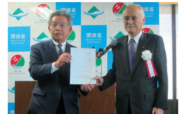
↑山本公一環境大臣から認定証を受け取る中川副町長

なお、上市町エコツーリズム推進全体構想(本文、概要版)は上市町ホームページでご覧ください。