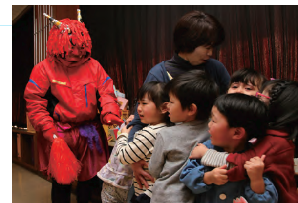
▲ 鬼はやっぱり怖いよ～。

また、お昼ごはんは鬼の顔をした「鬼さんランチ」をみんなで仲良くいただき、楽しい1日になりました。