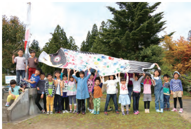
▲ みんなで作ったこいのぼりを掲げる子どもたち

参加者は、種地区のハゲ山ヘトレッキングに出かけた後、屋外でおやきづくりを体験し、里山の魅力を満喫した一日になりました。