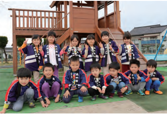
ひまわり組のみなさん (その2)