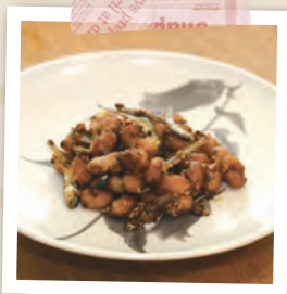
レシピは上市町ホームページにも掲載されています。ぜひご覧ください。 QRコード