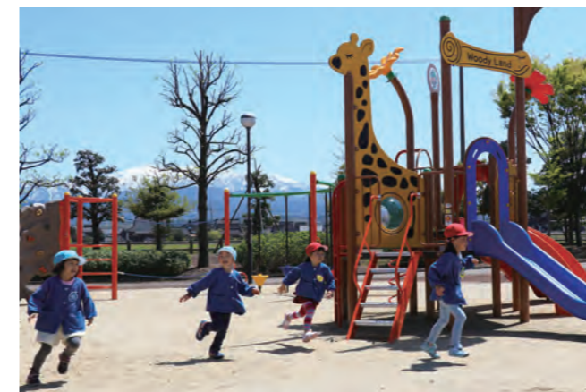
▲ 元気に遊ぶ南加積保育園の園児達

あさひの郷公園は、剣岳や立山連峰をよく望めることができる絶好の場所です。周囲にはケヤキ、カエデなど多彩な樹木が植えられていて、町民の憩いの場所として親しまれています。