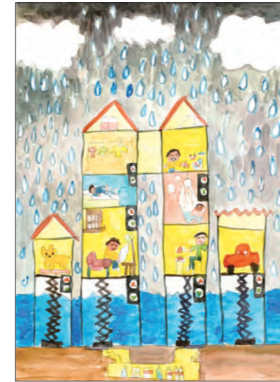
大雨がふってもあしんな家

大雨で家が水びたしになって、こまっている人をニュースで見て、エレベーターみたいに部屋が上になる家があればいいなと思って描きました。