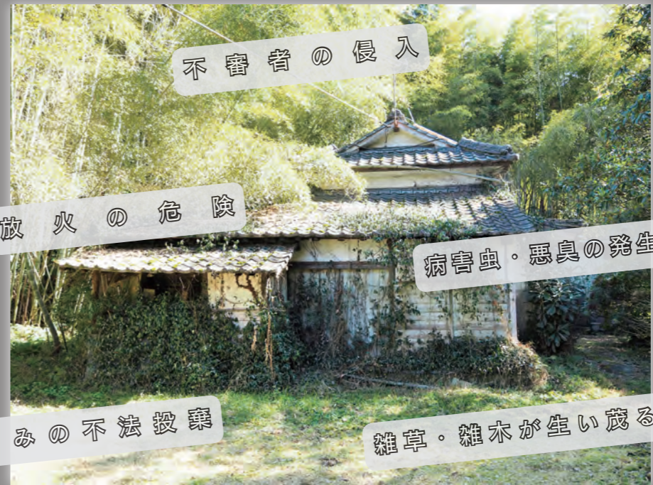
管理が全くなされず放置され、迷惑空き家になってしまったイメージ写真

突然ですが空き家所有者の皆さん、その家は維持管理するためだけの「空き家」になっていたりしませんか？もつと有効に活用できるかもしれません。