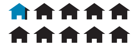
※住宅・土地統計調査に基づく数値

町消防分団や町内会長等からの情報提供を受け、町が直接現状を把握している空き家の数は366戸。