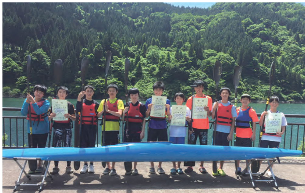
▲ 上市中レーシングカヌー部の選手のみなさん

今月、富山県上市カヌー競技場（上市川第2ダム・早乙女湖）で「JOC ジュニアオリンピックカップ 平成 29 年度全国中学生カヌー大会」が開催されます。大会期間中は会場が大変混雑し、駐車場の不足が予測されますので、会場へはシャトルバス（役場と会場を往復）でお越しください。全国から集まる選手達に大きなご声援をお願いします。