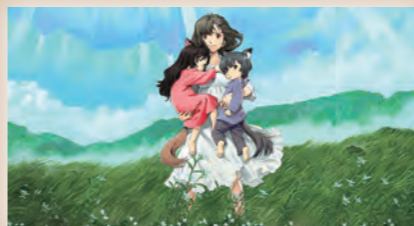
細田守監督の作品 アニメ映画「おおかみこどもの雨と雪」

自然に囲まれた里山を舞台に、母(花)とその子ども達の成長を描いた作品。平成 24 年夏に公開され、今でも国内外に幅広い年代で根強いファンが多い。