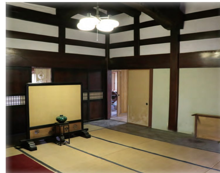
有効活用ができないか見せていただいた町内の古民家

▲上記物件のお問い合わせ先 有限会社フジ企画（上市町法音寺2-1） ☎076-472-1601