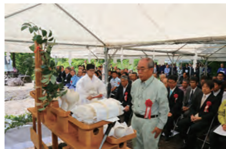
▲ 遭難犠牲者の冥福を祈る伊東町長