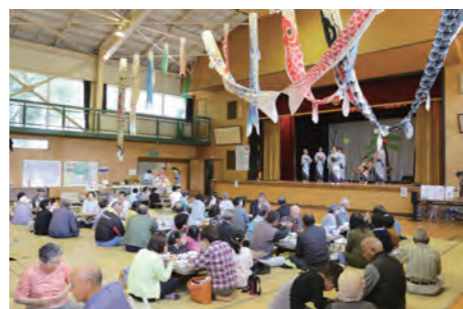
▲ 山の幸を楽しむ来場者