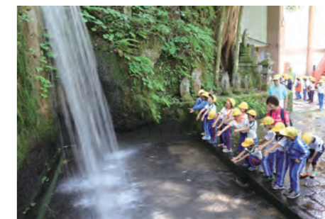
▲ 大岩六本滝の水しぶきを楽しむ児童

5月30日と31日の2日間、上市町内の小学2年生139人がふるさと学習の一環として午前中に大岩山日石寺を見学。午後からは中山間地の種地区へ行き、自然の中で遊ぶなど、町の身近な自然と文化を学び、理解を深めました。