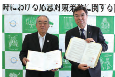
▲ 協定書を取り交わす伊東町長

6月9日、上市町と富山県電気工事工業組合は、「災害時における応急対策業務に関する協定」を締結しました。災害発生時に、富山県電気工事工業組合のスケールメリットを活かした公共施設の電気設備の早急な復旧を目的としています。