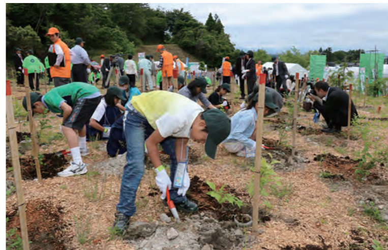
▲ 植樹する地元の児童など