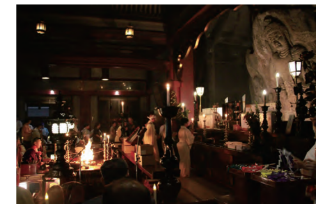
▲ 本堂で行われた護摩祈祷

その後、激しい雨が降る中、白装束に身を包んだ信者等が滝修行を行ったほか、「そうめん山菜まつり」も同会場で開催されました。