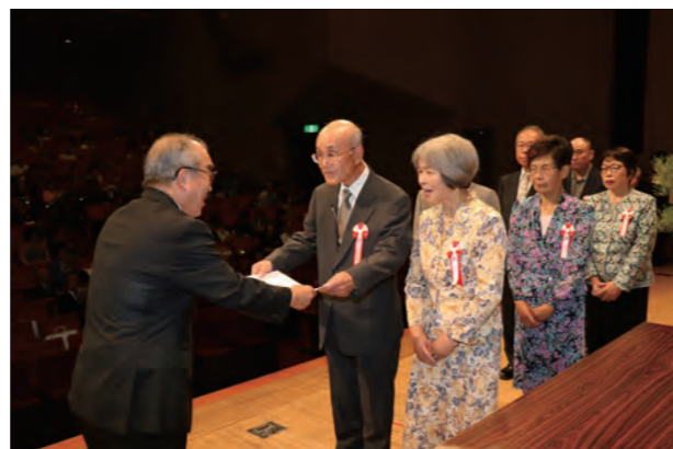
▲ 伊東町長から記念品を受け取る金婚夫婦のみなさん