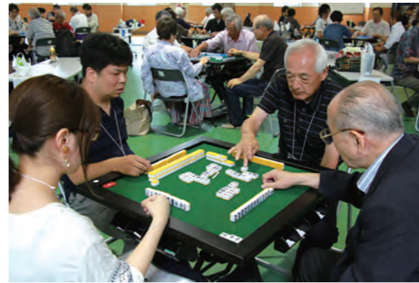
▲ 半荘4回戦のトータルスコアを競います

健康マージャンは「(お金を)賭けない」「(お酒を)飲まない」「(たばこを)吸わない」がモットー。今、各地で普及が進んでいます。