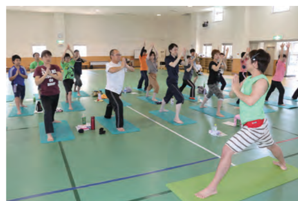
▲ フィットネスプログラム「グループセンチジー」の体験会