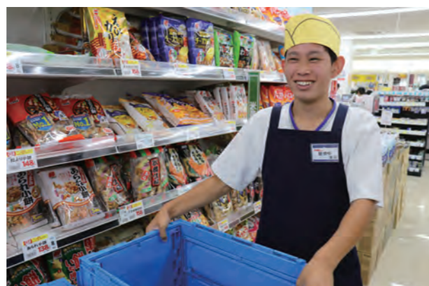
▲ スーパーで品出し作業をする中学生

生徒達は、「仕事は初めてのことばかりでとても大変です」「野菜をたくさん運びました。腰が痛いです」「スーパーの品出しは一日中立ち仕事です。仕事の大変さがよく分かりました」など、仕事の感想を話してくれました。