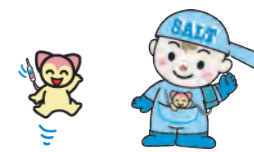
うす塩人 良塩くん