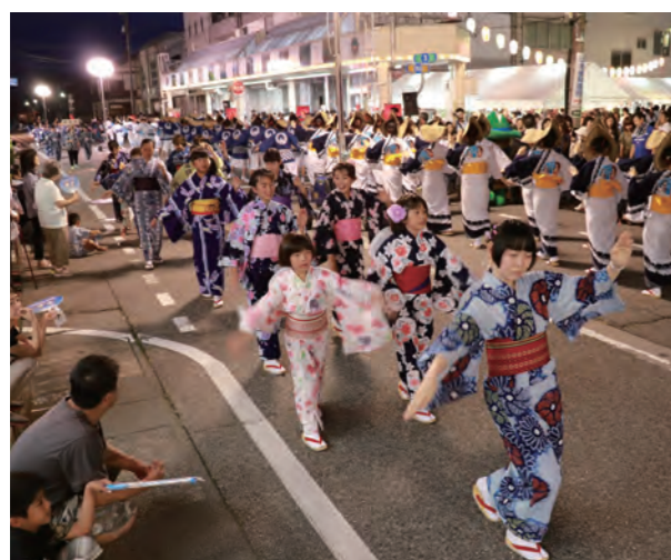
▲ そろいの浴衣姿などで踊りながら商店街を流す参加者

町流しには町内会や事業所など14団体約350人が参加。白竜橋付近では打上花火や精霊やぐら焼きが、カミール前ではビアガーデンやものまねショーが行われ、家族や友人と一緒にまつりを楽しむ大勢の人達で賑わいました。