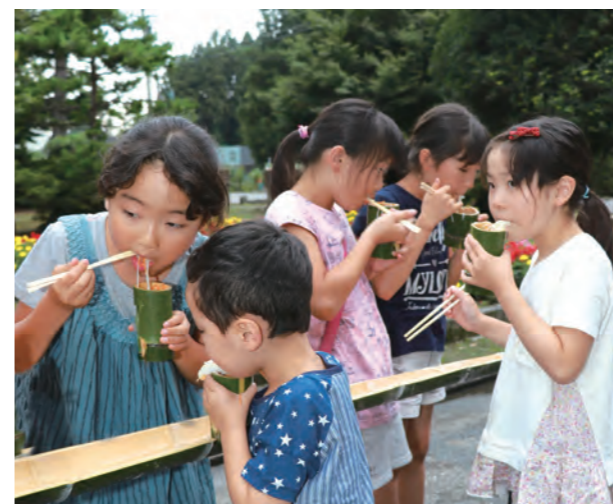
▲ 手作りの竹の器で流しそうめんを味わう子どもたち

会場では次々と流れてくるそうめん子どもたちが大歓声を上げ、大いに盛り上がりました。