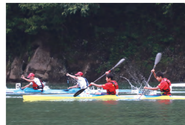
▲ カヤックペア準決勝