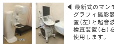
最新式のマンモグラフィ撮影装置(左)と超音波検査装置(右)を使用します。

2020年の東京五輪に向け、公共施設では禁煙の方針がより明確になってきました。上市町では、検診受診者の喫煙率は20%台前半で推移し、やや減少傾向ですが、ここ5年間ほとんど変わりません。全国ではすでに喫煙率は20%を切っており、上市町はそれに比べ少し遅れているようです。さて、電子タバコを利用される方もおられますが、電子タバコにも発癌物質が含まれており、禁煙するならばパツと止めるのがお勧めです。また、子どもたち