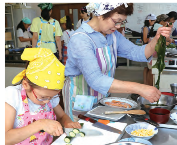
▲ 協力して料理する家族

子ども達は、日頃から料理をよく手伝っているとのことで、慣れた手つきで手際よく料理をしていました。