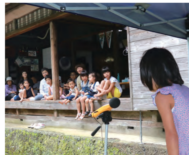
▲ 「アオーン」と叫び、声量や表現力を競う来場者

8月12日、浅生地区の「花の家」でNPO法人おおかみこどもの花の家が遠ぼえコンテストを開催し、県内外から12人が参加。お盆の5日間に県内外から1,297人が訪れ、スイカ割りやクイズを解きながら家の中を巡るスタンプラリーなどを楽しみました。なお、「花の家」は今年7月に来場者5万人を達成しました。