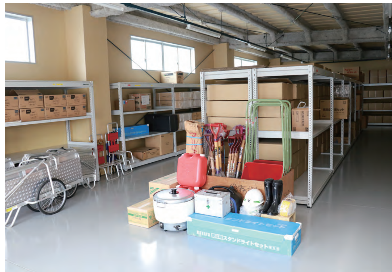
▲ 防災備蓄倉庫の内部