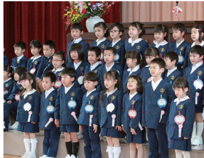
▲ 上市中央小学校の入学式