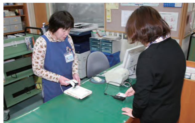
▲ マイナンバーカードをかざすだけで、本を借りることができます。

マイキーID登録URL https://id.mykey.soumu.go.jp/ お問い合わせ 上市図書館 ☎ 472-6494