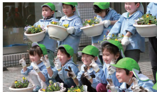
▲ プランターに花を植えた園児達