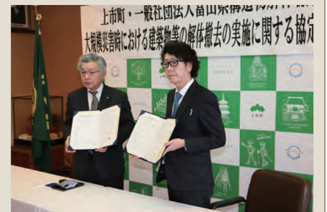
↑協定書を手にする中川町長と岡本会長(右)