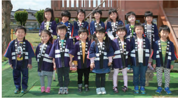
ひまわり組のみなさん