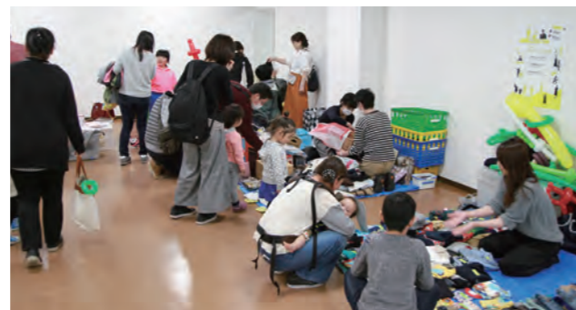
▲ 賑わうフリーマーケット

この日はまちなか交流プラザのリニューアルオープン初日だったこともあり、訪れた多くの方々の目を楽しませていました。