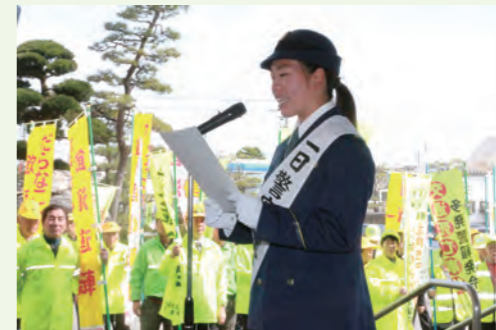
←春の全国交通安全運動出発式(4/6・役場正面)

立山町、上市町、舟橋村の2町1村で活動をする交通指導員28名に委嘱状が手渡されました。