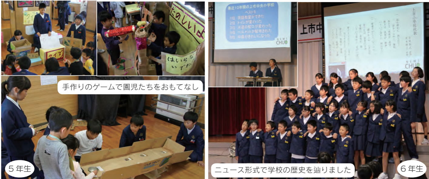
手作りのゲームで園児たちをおもてなし