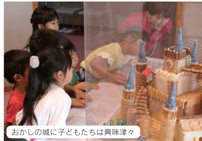
おかしに子どもたちは興味津々

文化センターでは、「それいけ! アンパンマンショー」や音杉・南加積・三日市それぞれの保育園による踊りや鼓笛隊のステージ発表、県の子育て施策の紹介などが行われました。また、研修センターでは、「ちびっこめいろ」や伝承おもちゃづくりなどで子どもたちを楽しませていました。