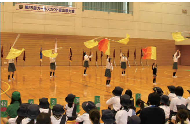
▲カラーガードを披露する第36団の団員たち

式典後のアトラクションでは、上市町で活動している第36団の団員が、手作りのフラッグを使ったカラーガードを華麗に披露しました。