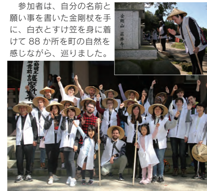
▲お砂踏み体験後に参加者全員で記念撮影

参加者は、自分の名前と願い事を書いた金剛杖を手に、白衣とすげ笠を身に付けて88か所を町の自然を感じながら、巡りました。