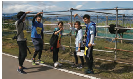
◀ダチョウと撮影（広野市内）