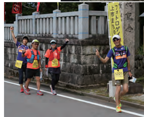
◀チェックポイントへ向かう参加者