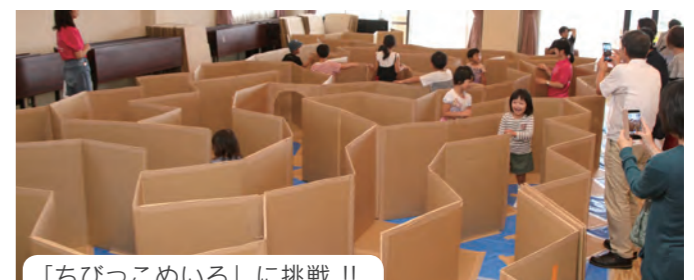
「ちびっこめいろ」に挑戦!!