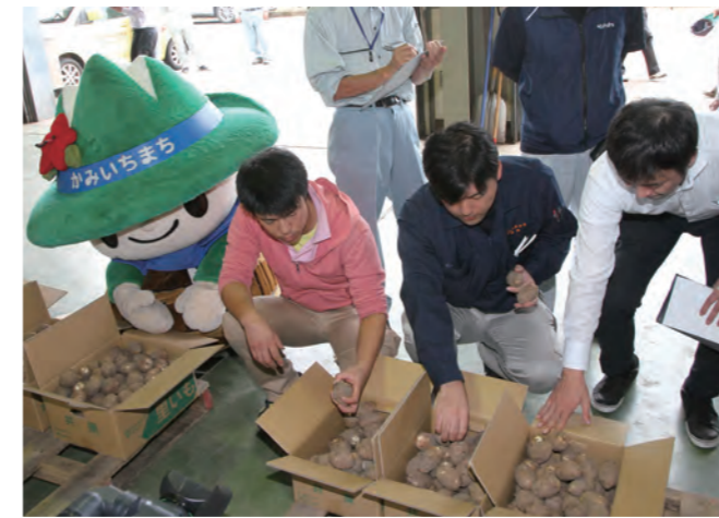
▲さといもの出来を確認する市場関係者

今年は6、7月の降水量が少なく猛暑も影響して、平年に比べて玉が小さい傾向ですが、品質は申し分ないとのこと。市場関係者は、「まだまだ小さいイモが多いが、今後に期待したい」と話しました。今年は農家64戸が計11haで栽培し、12月中旬まで65tの出荷を見込んでいます。