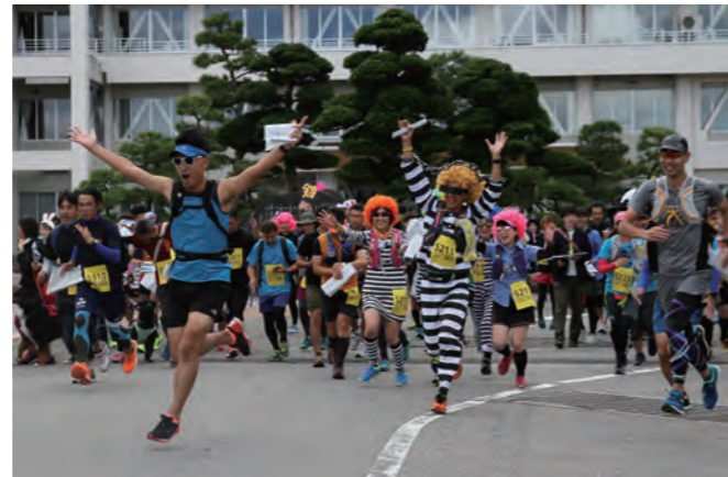
▲午前10時に役場前から一斉にスタート!!

町の観光スポットなどのチェックポイントで決められたポーズで写真を撮影して得点となるこのスポーツ。参加者は、町の魅力を大いに満喫しました。