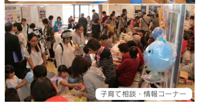
子育て相談・情報コーナー