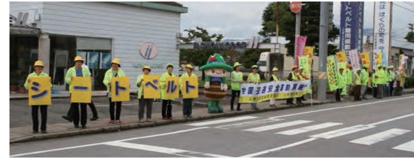
▲ 出発式後、人波行動を行う参加者たち