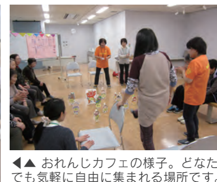
◀▶ おれんじカフェの様子。どなたでも気軽に自由に集まれる場所です。