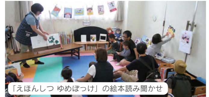
「えほんしつ ゆめぼつけ」の絵本読み聞かせ