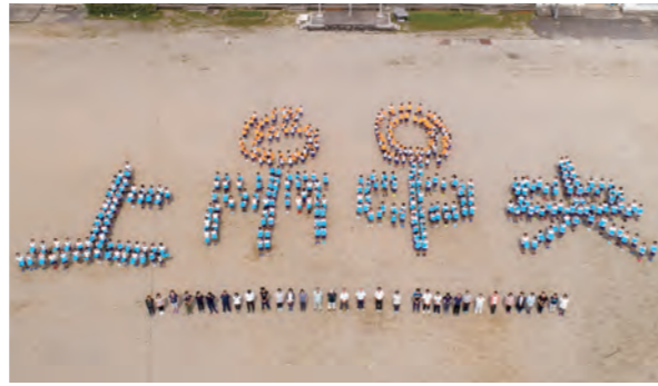
▲ 児童たちで作った「60 上市中央」の人文字

また、入学前の保育園児とのふれあいコーナーでは、5年生が園児たちをおもてなし。楽しくゲームやクイズに挑戦していました。