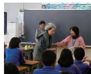
◀▶ 認知症サポーター養成講座の様子。小・中学校でも実施しています。