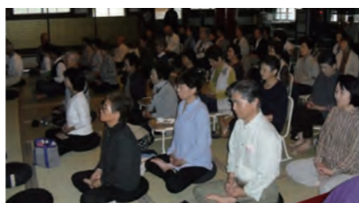
▲ 10/10 座禅体験(眼目山立山寺)