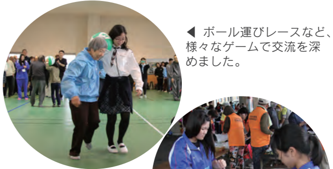
◀ボール運びレースなど、様々なゲームで交流を深めました。