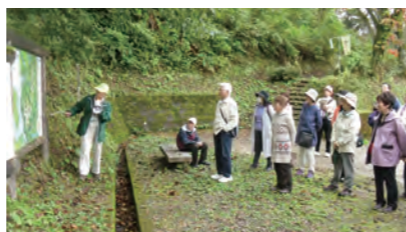
▲ 10/25、30 増山城跡見学(魚津市)