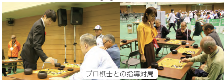
プロ棋士との指導対局