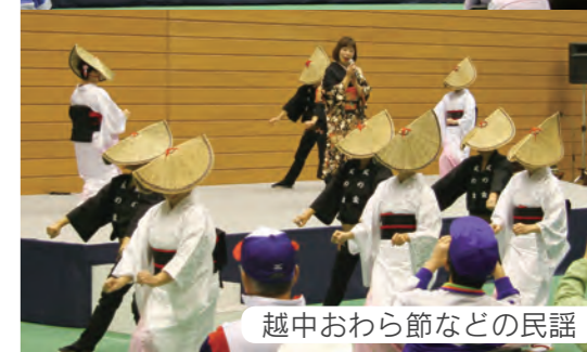
越中おわら節などの民謡