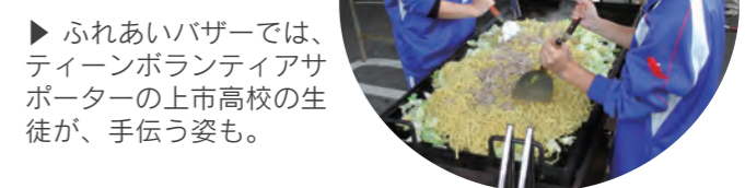
▶ふれあいバザーでは、ティーンボランティアサポーターの上市高校の生徒が、手伝う姿も。