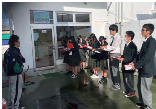
松井エネルギーモーターズ株式会社