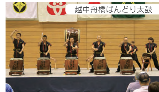
越中舟橋ばんどり太鼓