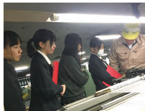
細川機業株式会社