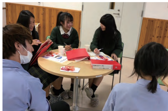
株式会社コージン