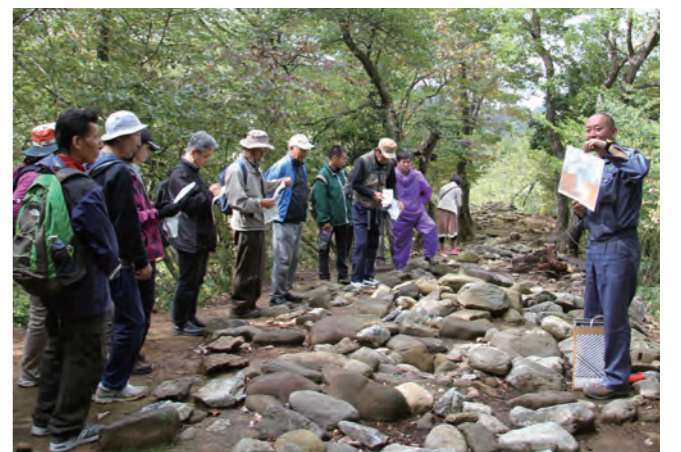
▲「黒川の宝」について学ぶ参加者（円念寺山経塚にて）

10月28日、第18回黒川フェスティバルが、穴の谷駐車場をメイン会場に開催され、来場者は、地域の食や歴史の魅力を満喫しました。午前中に行われた「黒川の宝」めぐりウォークでは、遺跡群などを巡り、黒川地区の歴史について学びました。午後からはメイン会場で、黒川音頭や南っ子クラブによるバンド演奏などが披露されました。また、飲食販売コーナーも設けられ、来場者は、茗荷寿司やサトイモ鍋に舌鼓を打っていました。