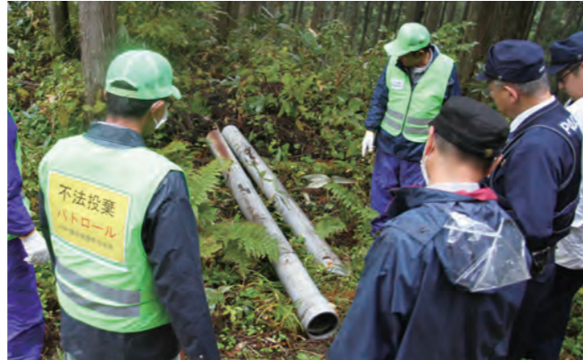
▲パトロール中にも廃棄物が確認されました

11月6日、上市町環境保健衛生協会が、釈泉寺地内のまま子滝周辺を上市署員と共にパトロールし、不法投棄の禁止を呼び掛ける看板を設置しました。パトロール中にも空き瓶やポリタンク、塩化ビニール管などが捨てられているのを確認、回収しました。今後もパトロール活動を続ける予定です。町の環境保全のためにも、廃棄物は、ごみステーションに出す、ごみ収集業者に依頼する、などの対策をとり、絶対に不法投棄はやめましょう。