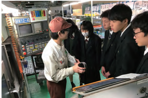
株式会社内山精工