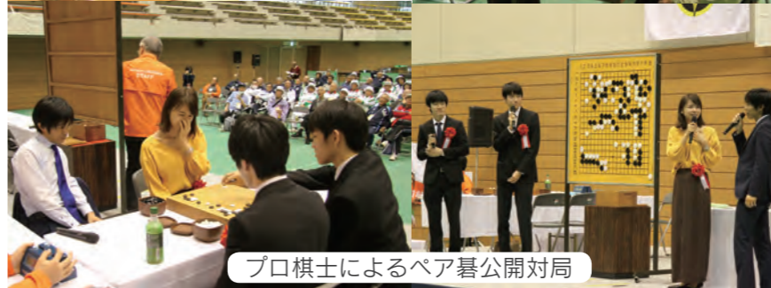
プロ棋士によるペア碁公開対局