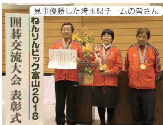
見事優勝した埼玉県チームの皆さん