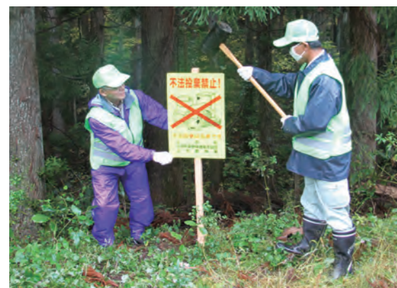
▲協会役員が不法投棄禁止の看板を設置

ごみを違法に捨てた者は、5年以下の懲役若しくは1,000万円以下の罰金に処されます。