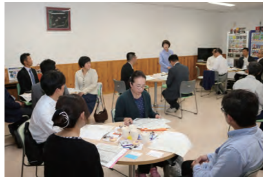
町や中小企業経営者たちでつくる「ハッピー上市会」が協力して実現

生徒たちは、見学するなかで、年の近い上市高校卒業生の先輩社員から仕事内容の説明や仕事に対する思いを真剣な表情でメモをとりながら聞いていました。