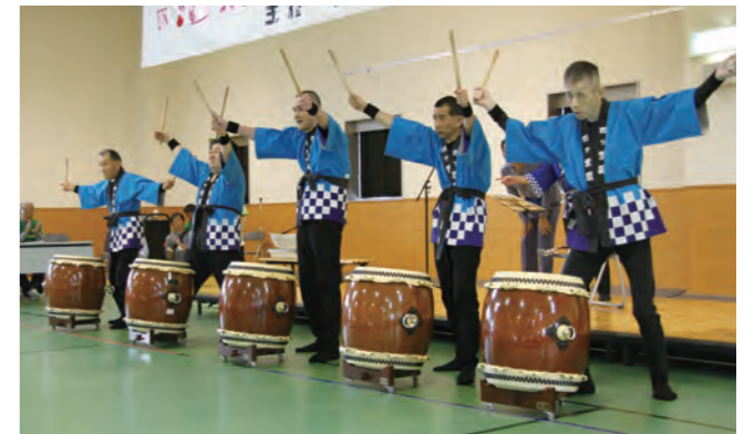
▲音楽に合わせて力強いばちさばきを披露（四ツ葉園太鼓クラブの皆さん）