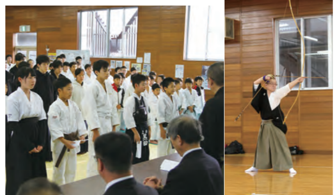
▲各団体の代表による誓いの言葉(写真左)、福澤会長による矢渡し(写真右)