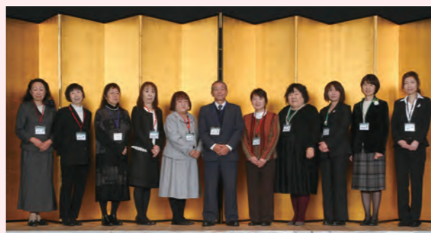
▲ 各公民館主事の皆さん(1月13日はたちのつどいにて)

平成31年の成人式「はたちのつどい」も、各地区の公民館長・主事の皆さんの運営サポートにより、無事開催することができました。