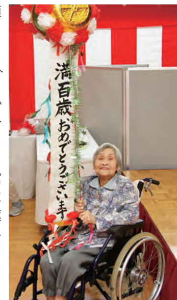
お祝いのくす玉を割り笑顔の節代さん ▲

また、この日は、宮川公民館で民謡講座に通う方々がお祝いに駆け付け、踊りを披露しました。