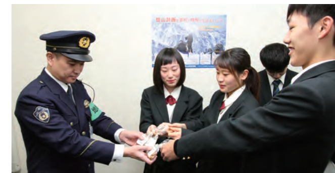
▲上市高校生から上高パンを受け取る久々湊地域課長