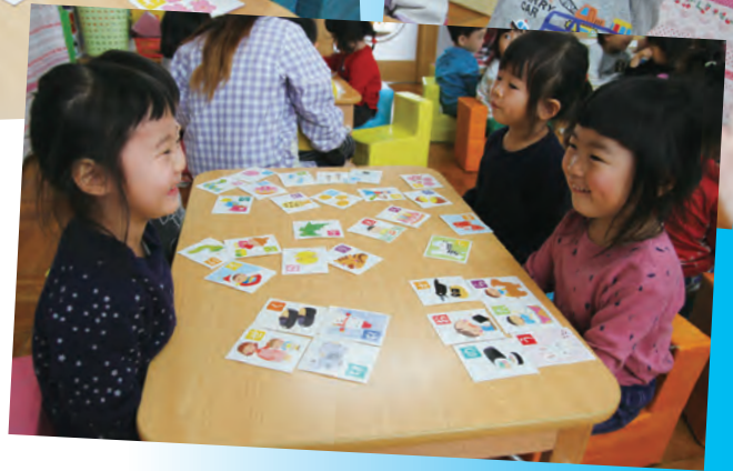
一番たくさんとれました!