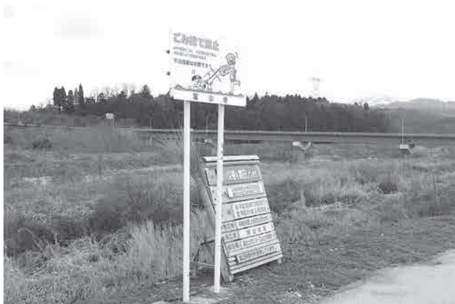
上市川・災害復旧工事