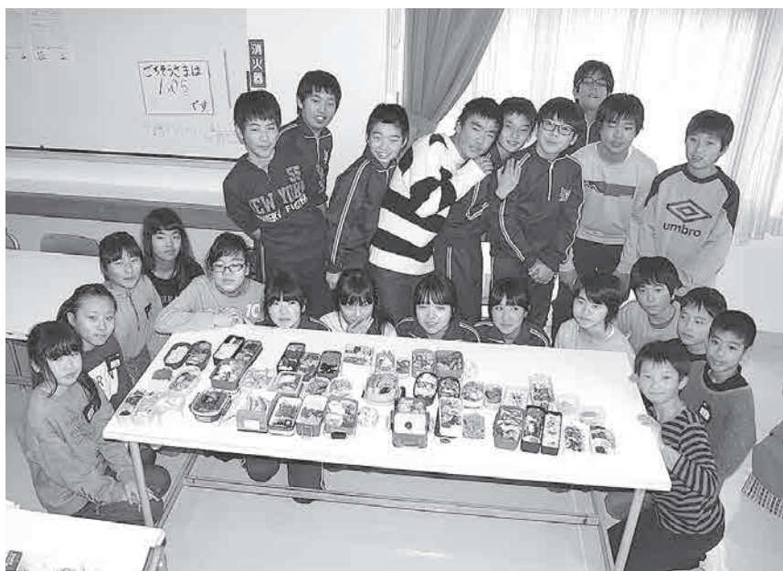
美味しそうに並んだ「子どもが作ったお弁当」

議員 陽南小学校で実施した、子どもが作る「弁当の日」を、町内全ての小学校に普及・実践できないか検討してほしい。