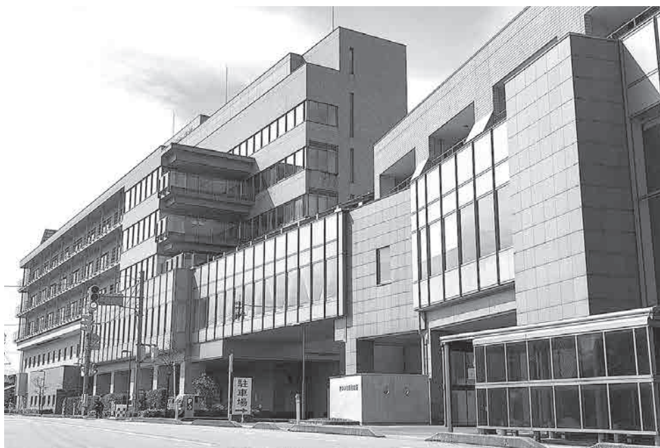
「全国がん登録」が集計されたかみいち総合病院