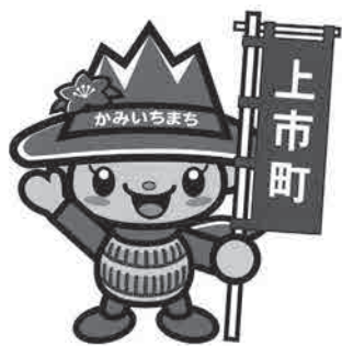
上市町マスコットキャラクター「つるぎくん」