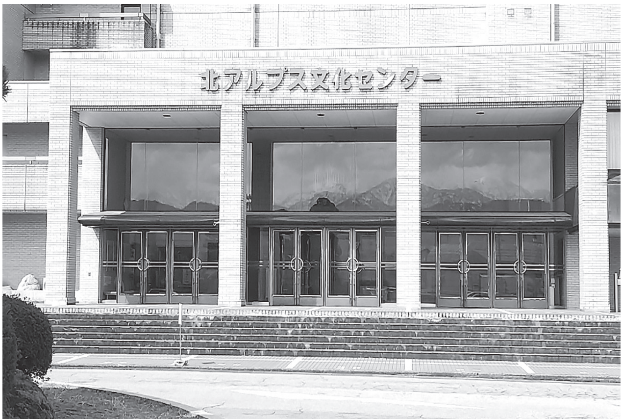
上映会を希望する北アルプス文化センター