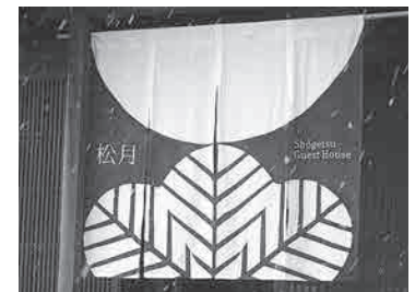
料亭跡を再生したゲストハウス松月

産業課長 現時点で宮川地域工業団地の完成時期は未定。近隣市町村の事例も参考にして、企業に進出してもらえよう啓発に努める。