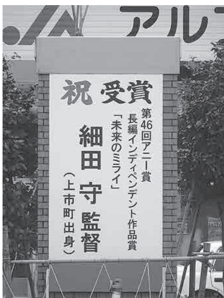
上市駅前に掲げられた細田守監督の「アニー賞」受賞を祝う看板

総務課長 マイ・タイムラインの検討用資料を提供すると共に、自主防災会への情報提供をおこなう。防災地図（洪水編）の改訂・配付の際に、マイ・タイムライン作成を呼びかける。