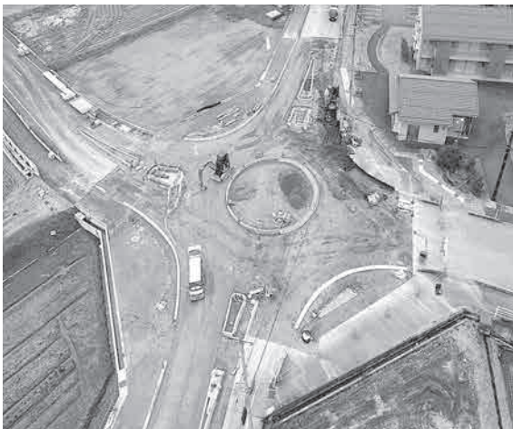
女川地区に建設中のラウンドアバウト

建設課長 平成31年度には「上市町通学路交通安全推進会議の安全点検」を基に、上市中学校前の車道部分でカラー舗装の予定している。北陸銀行の地下歩道入口前へのポール設置については、道路管理者である富山県と協議し、対応を検討する。