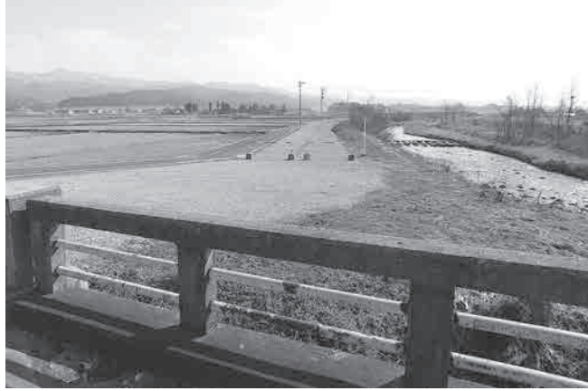
白岩川・新しい堤防