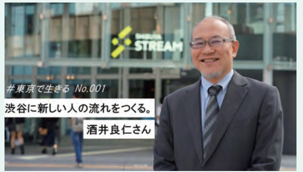
# 東京で生きる No.001