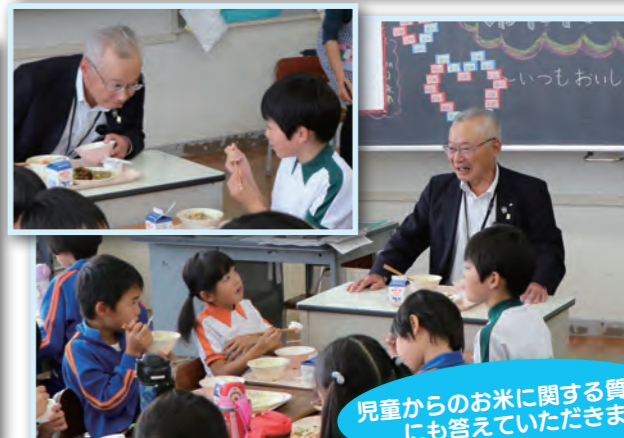
児童からのお米に関する質問にも答えていただきました