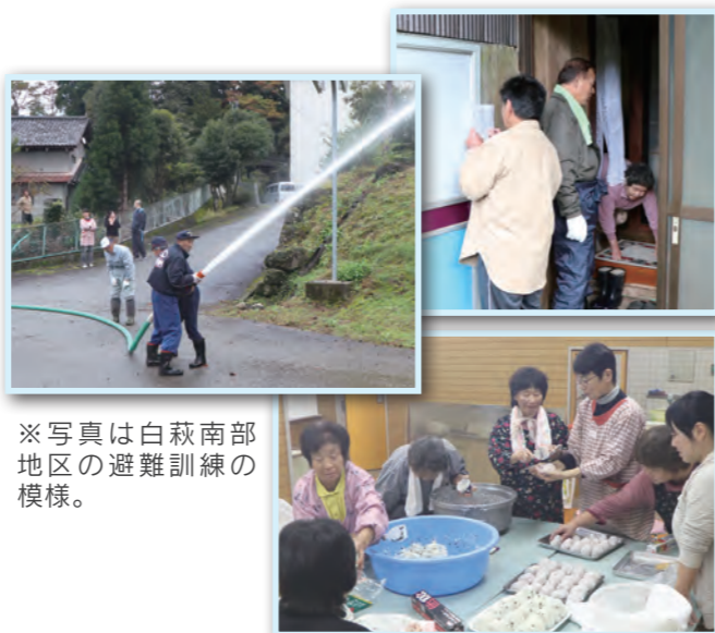
※写真は白萩南部地区の避難訓練の様子。