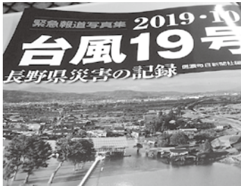
信濃毎日新聞の台風19号特集誌