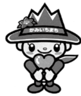
マスコットキャラクター "つるぎくん"