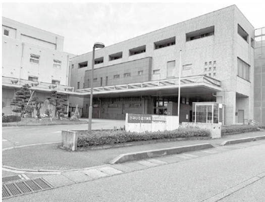
かみいち総合病院 外観

今回は、県やほかの病院とも連携をとっていただいて、横のつながりを強化して対応してほしい。さらに欲を言えば、採算面で改善している病院と交流を深めて、上市にふさわしいヒントやエッセンスを修得するような職員の往来などの仕組みを作れないものか。