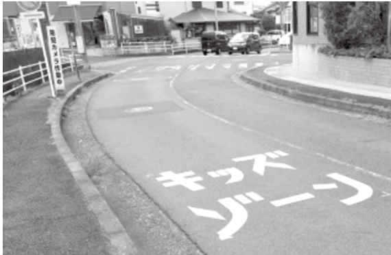
キッズゾーン

今年7月、町は全保育園の散歩コースを再点検し、危険箇所を抽出し、移動経路の安全性や引率職員の体制などについて再確認を行った。今後、事故防止及び安全対策が徹底