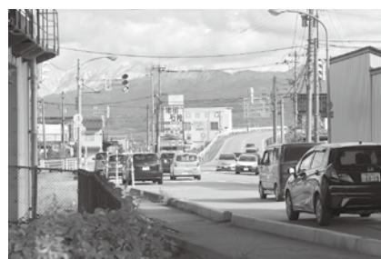
改善が求められる正印新交差点