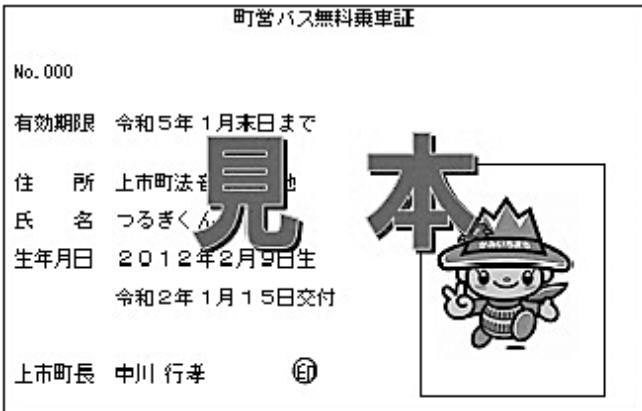
町営バス無料乗車証

その他の質問 ・滑川中新川地区広域情報事務組合 net3の譲渡について ・プレミアム付き商品券について