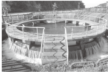
積泉寺地内の円筒分水槽

議員 11月の文化審議会で、魚津市と南砺市の円筒分水槽が国登録有形文化財に登録される事となった。積泉寺の円筒分水槽の登録に向けた、今後の活動を考えているのか。