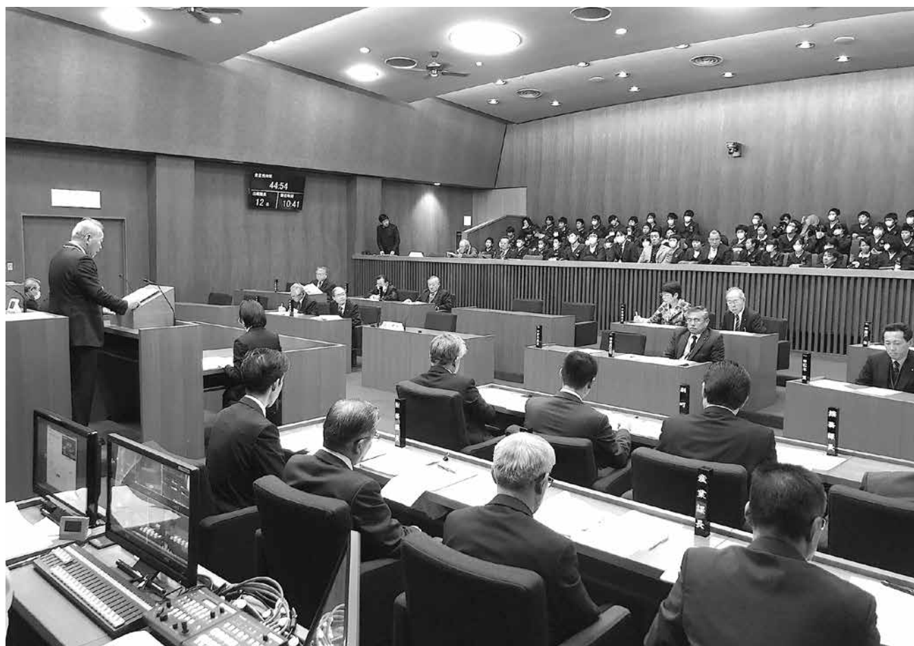
議場の様子（上市中央小学校6年生が一般質問を傍聴されました。）