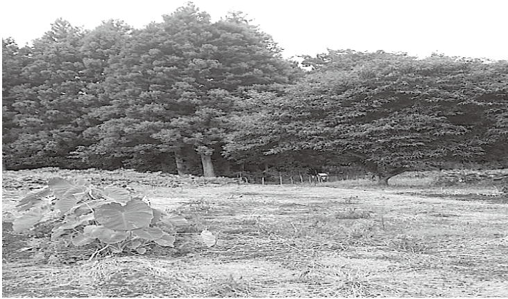
「イノシシが出る森」

町長 奥山の柿や栗の保全について、立山山麓森林組合に確認したところ、通常間伐等の森林施業を行う際に、山林所有者から果樹伐採への要望がない場合は、可能な限り存置させるよう作業を