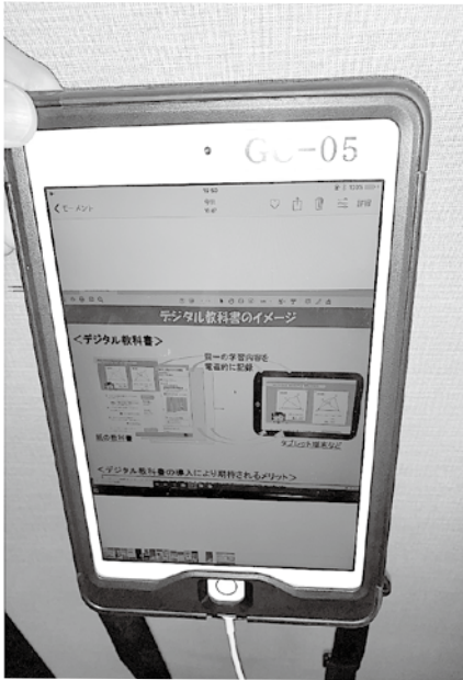
指導者用のタブレット端末

小学校で使用する教科書は、基本的に4年に一度の採択替えで、今年度がその採択の年だが、従来通り紙ベースでの無償供与である。