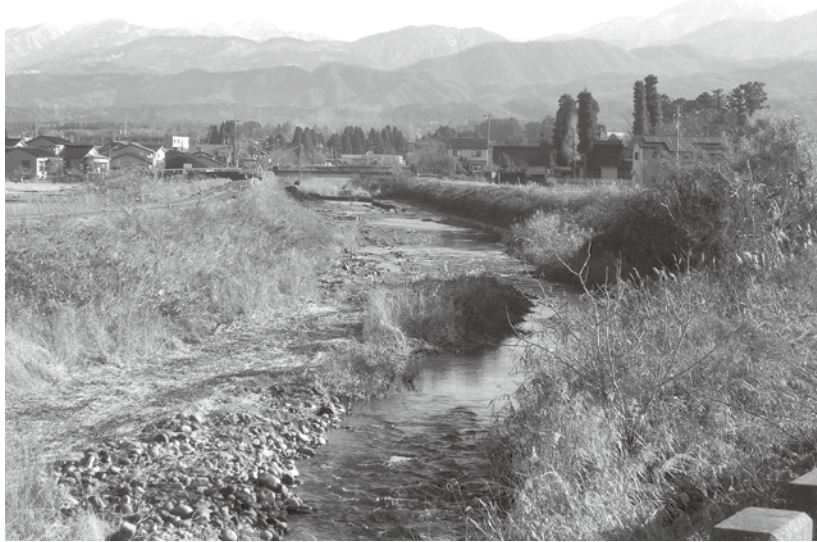
白岩川水系大岩川(浚渫工事中)

さらに、町の開発行為指導要綱だが、近年のゲリラ豪雨による被害が発生していることから、来年度より、雨水調整施設（調整池）に関する基準の確率を5年から10年に引き上げる見直しを行う。