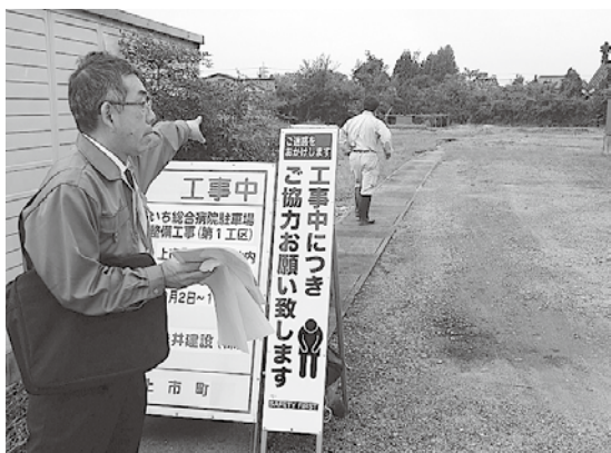
かみいち総合病院の新駐車場予定地