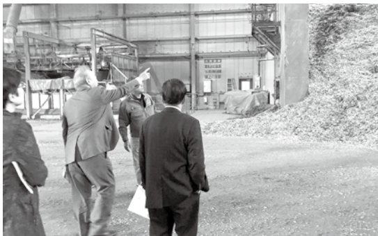
バイオマス発電用にチップ加工された木材の説明を受ける議員

視察先の下呂市では捕獲したイノシシ等の処分対策として、今年度に有害鳥獣中間処理施設を建設。冷凍庫に一時保存した後、解体用バンドソーで30cm程度に小さくしてから焼却処理をしている。施設整備費1058万円。備品購入費602万