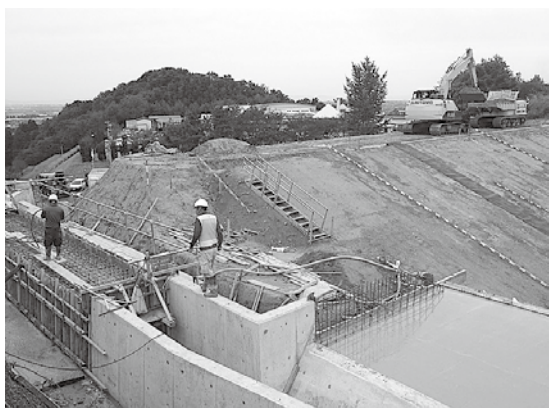
七郎谷の池の工事現場