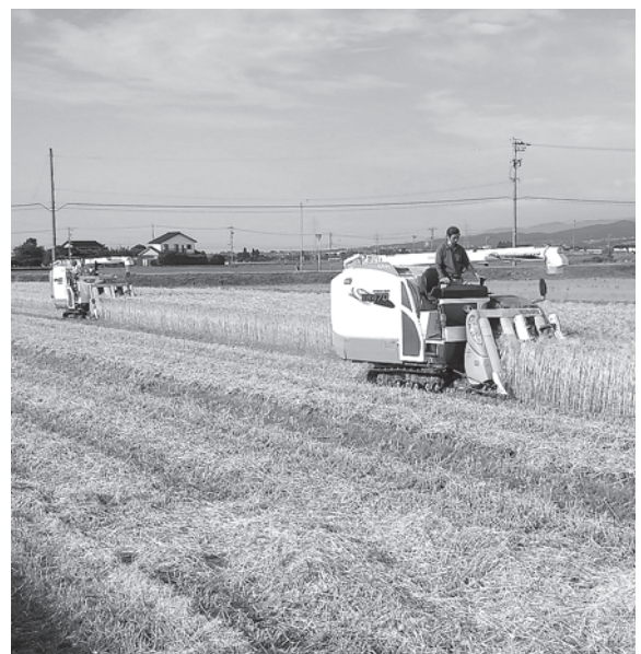
大麦収穫作業風景

産業課長 課題は①ハトムギ用の専用農機が必要、②連作不可にて相当規模の圃場が必要、③播種時発芽不良に対する排水対策が必要。