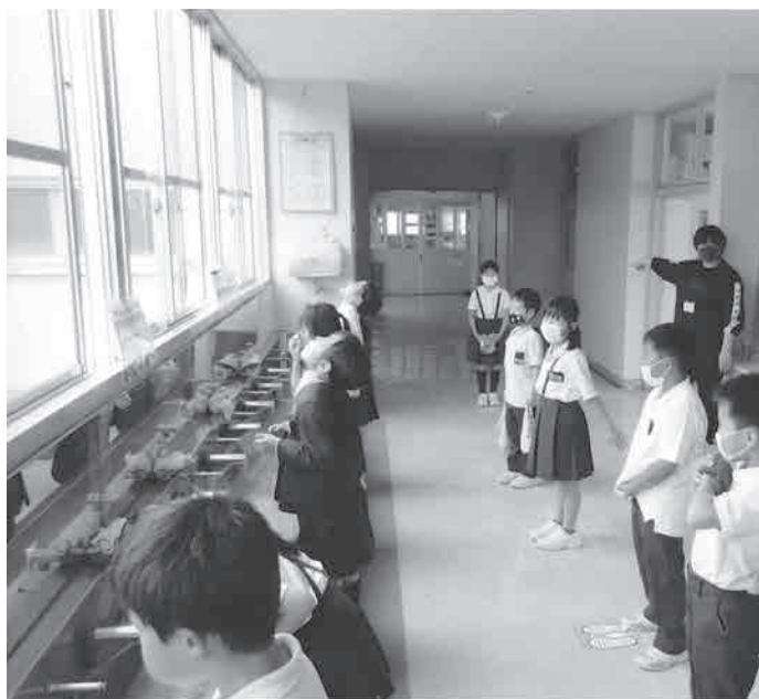
手洗い・うがいをする児童(上市中央小)

教育長 学校現場での感染予防対策については、文部科学省の衛生管理マニュアルに基づき、3つの密を避け、座席の間隔を1m以上とり、またマスク着用や手指消毒などの基本的な感染対策を継続する「新しい生活様式」に取り組みとともに、家庭での実践を保護者にもお願いし、感染予防に努める。