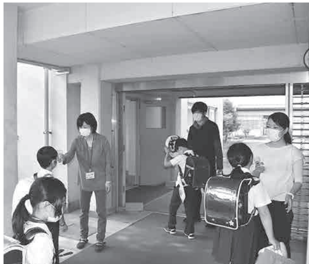
登校する児童を検温する先生(上市中央小)