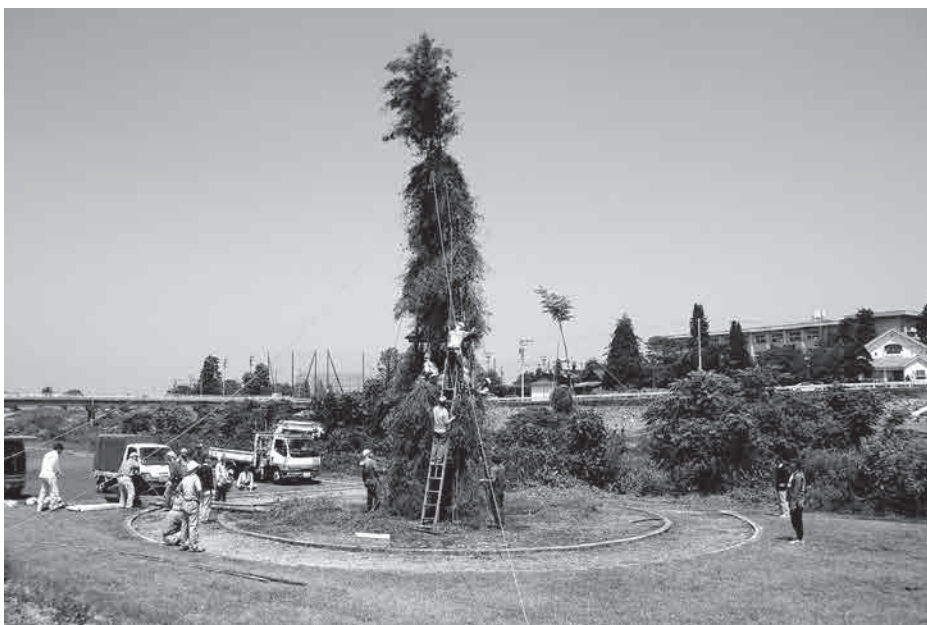
精霊やぐらをつくる様子

町長 実施の是非は各町 内会の判断に委ねられる べきもので新型コロナウイルス 感染症拡大防止のた めに中止という判断をさ れた場合であっても、町 としてはやむを得ないと 考えている。