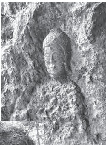
鶴仙窟 内部の石仏

町の魅力向上と郷土愛 の醸成に資するものと考 え、今年度の洞窟調査事 業を踏まえて歩道整備な ど産業課と連携しながら 支援に努める。