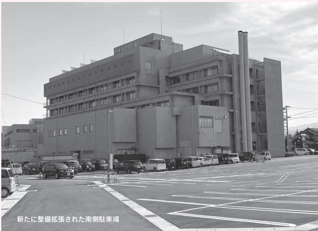
新たに整備拡張された南側駐車場

今後も安心・安全な拠点病院として利用できるよう要望していきますので、皆様のご支援、ご協力を宜しくお願い致します。