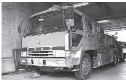
化学消防ポンプ車