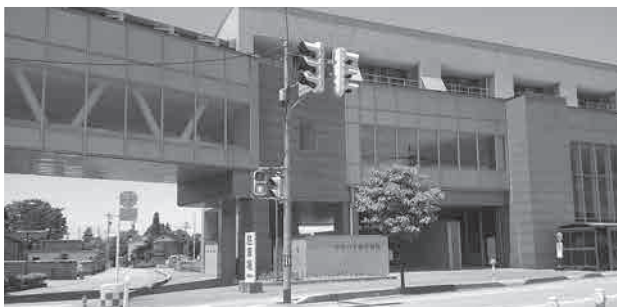
かみいち総合病院外観