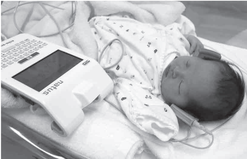
新生児聴覚スクリーニング装置で検査中(かみいち総合病院)