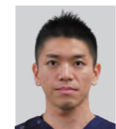
がみいち総合病院