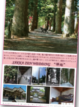
◀ 魂と魂が結び合う名刺で挙げる"禅婚"。二人の記憶に残る感動の結婚式を挙げませんか。