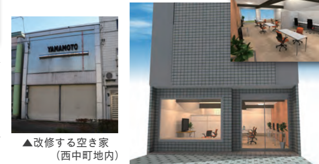
▲改修する空き家(西中町地内)