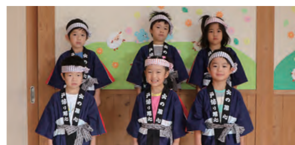
ニチイ弓庄保育所幼年消防クラブの皆さん