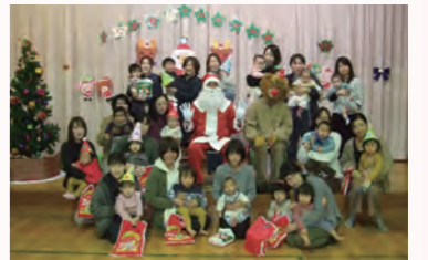
▲昨年の合同クリスマス会の様子