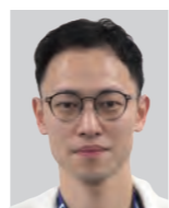
かみいち総合病院