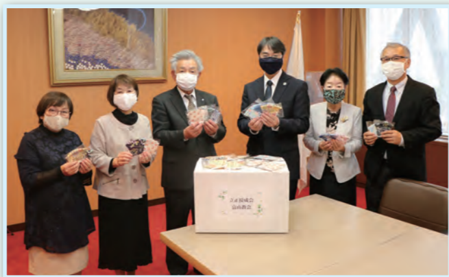
立正佼成会富山教会様（11月2日） 福祉事業所・保育所などへ 手作りマスク 500枚

新型コロナウイルス感染症の影響で、物資が不足する中、企業や個人から多くの善意が届けられました。ここでは、その一部を紹介します。