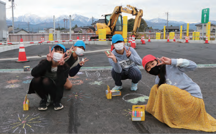
宮川小学校児童の作品