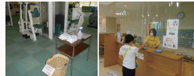
▲施設各エリアの消毒剤設置 ▲入館時のマスク着用・検温・飛沫防止対策など

皆さんが安心して来館できるよう、(一社)日本フィットネス産業協会が定める「新型コロナウイルス感染症拡大対応ガイドライン」に沿った対応を行っています(写真は対応の一部)。