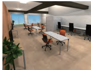
▲オフィス内観（イメージ）