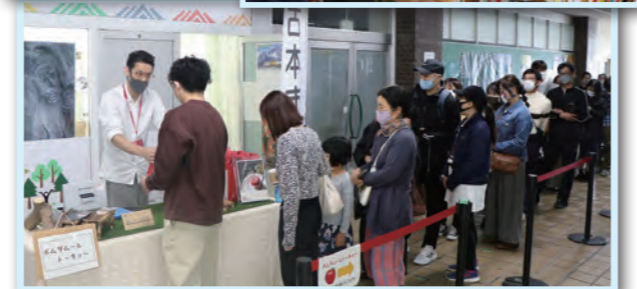
▲ポムダムールトーキョーのりんご館を求めて、多くの人々が行列を作っていました。