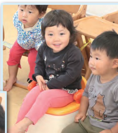
▲早速、寄贈された椅子型おまるに座ってみて、お気に入り様子の子もたちでした。（10月27日、南加積保育園）