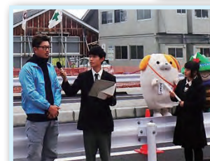
▲現場リポーターとして上市高校生が大活躍！