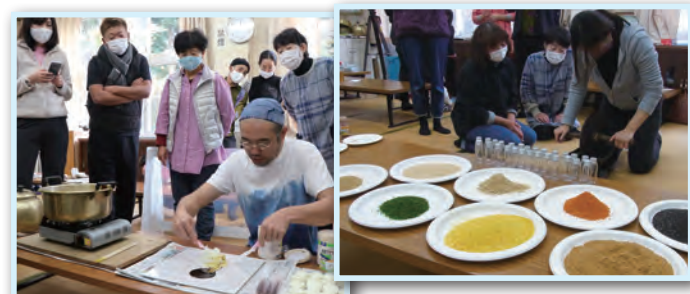
▲キハダを煮立たせて成分を濃縮させた液体とワセリンを混ぜて軟膏を作りました。 ▲薬の材料を砕いて粉末状にする道具「薬研（やげん）」を使って材料をすりつぶし、ブレンドして、七味唐辛子を作りました。

上市町観光協会では、来年も「百薬」講座を開催する予定です。皆さん、このセミナーを通して薬草の世界をのぞいてみてはいかがでしょうか。