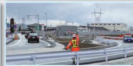
▲開通直後から多くの車がスマートICを利用していました。