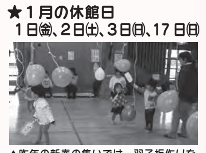
▲昨年新春の集いでは、羽子板作りをしてみんなで風船羽根つきをしました。

★開館時間 月～金 10:00～18:00 土・日・祝日 9:00～17:00 ★1月の休館日 1日(金)、2日(土)、3日(日)、17日(日)