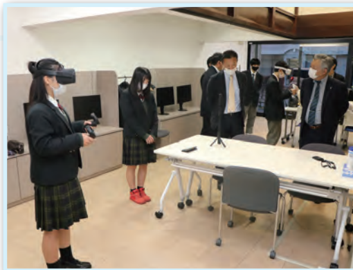
▲VRを体験する上市高校生たち

このサテライトオフィスでは、社員がシステム開発やウェブ会議を行うほか、平日夕方には1階のスペースを解放し、VRなどを体験できる場として利用できるようになります。