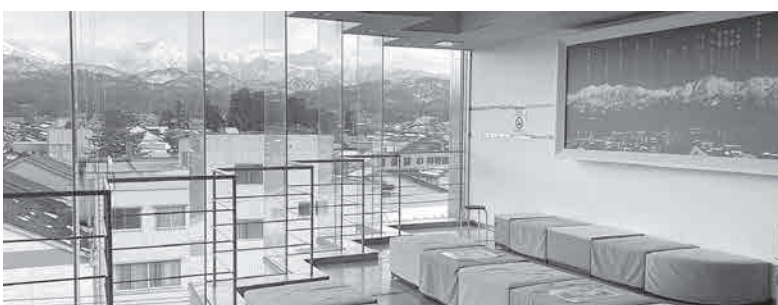
カミール4階から望む劔岳

町長 管理不行き届きとならぬよう安全管理を徹底する意味でやむを得ず実施している。4階踊り場の利用を希望される場合、あらかじめ公社事務室に立ち寄ってもらえれば、ご利用いただくことは可能。