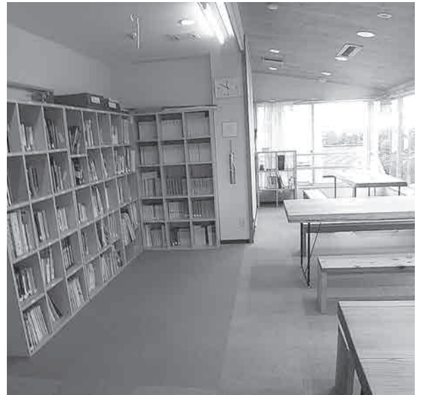
西田美術館：劔岳資料コーナー

岳―線の記」には、大岩日石寺や黒川遺跡群と劔岳の関係が深く解明されており上市町の歴史は劔岳と共にあることがわかる。