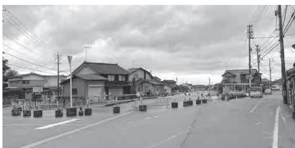
県の街路事業 (県道横越荒田線)

県の街路事業で富山土木事務所が事業実施している。まだ、用地買収の交渉中であり、荒田側の終点で建物の取り壊しを行っている。物件移転が終われば部分供用開始も見えてくるが、現時点では未定。