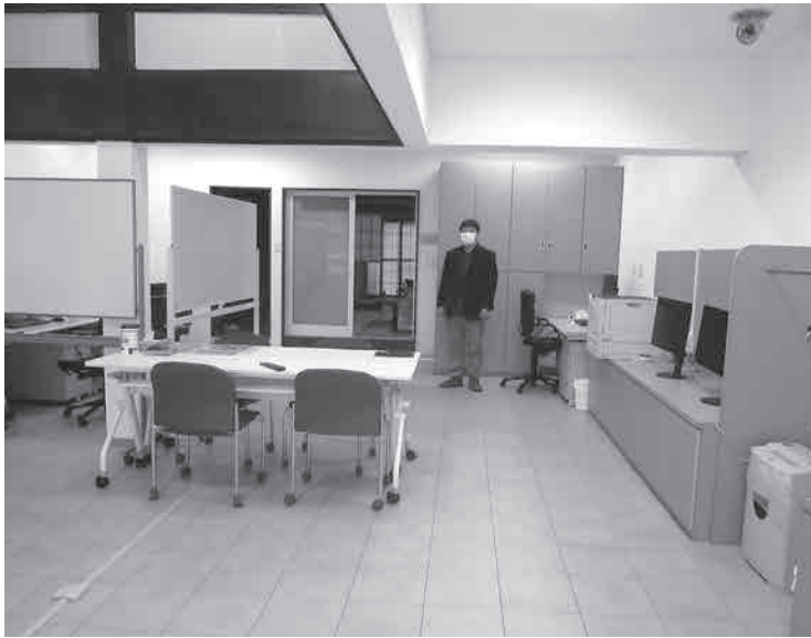
町へ誘致した第1号のサテライトオフィス「㈱アルティネット」の内観