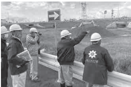
スマートIC現場確認の様子