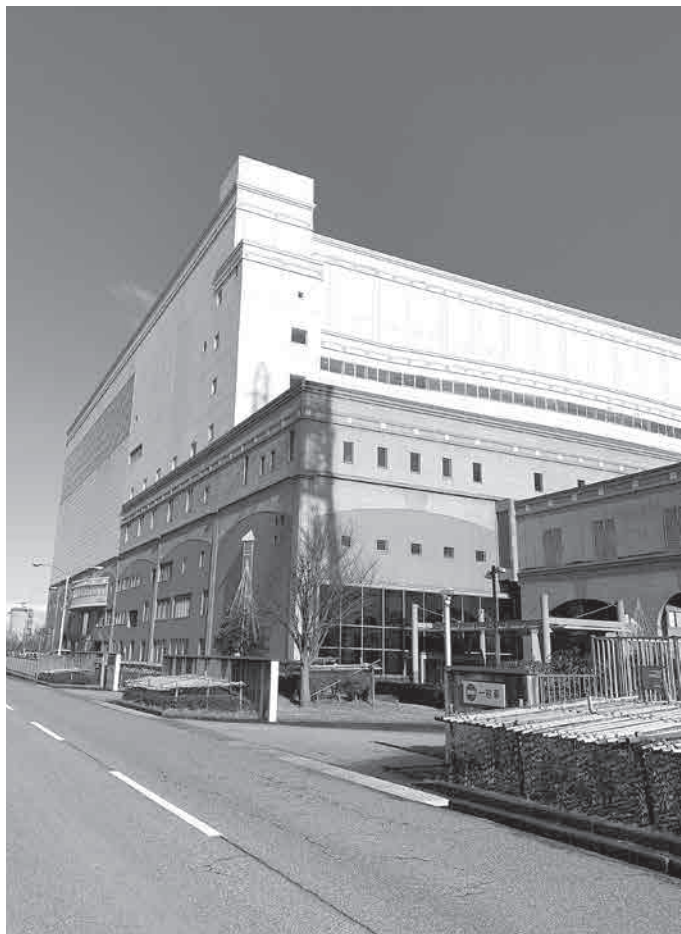
富山地区広域圏クリーンセンターの外観