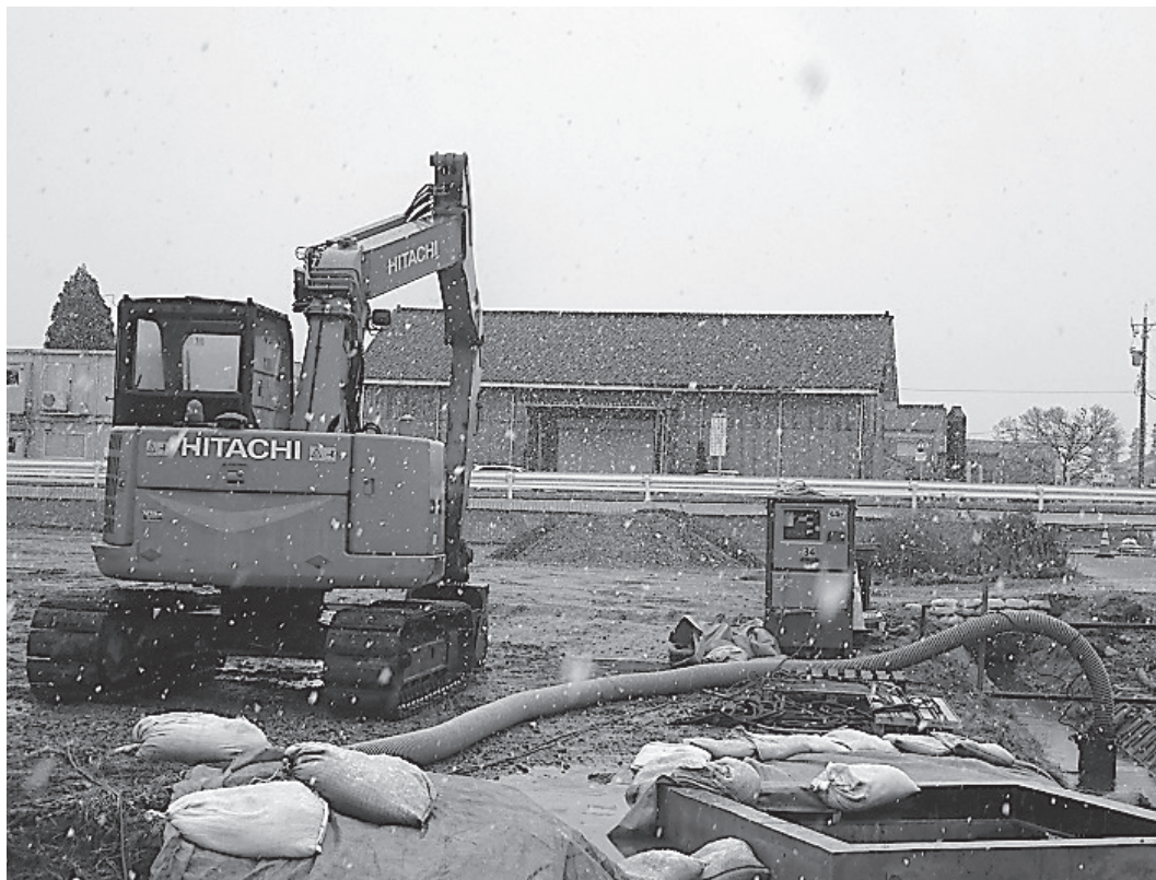
駐車場等の工事を進める上市スマートIC

線だが収益性その他の課題は多く、まずはバス停がしつかり乗降実績を出すことが第一歩だ。