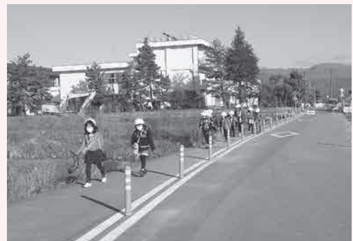
視線誘導標設置状況

通学路は、常に危険と隣り合わせ。大津市で発生した、歩道で信号待ち園児の列に車が突っ込んだ事故を受け、当町での危険箇所の見直しに伴い、歩車道境界に34本のポール（視線誘導標）を設置して頂きました。しかし、安全運転に勝る危険の回避はありません。町民の皆様にも、安全運転のご協力をお願い致します。