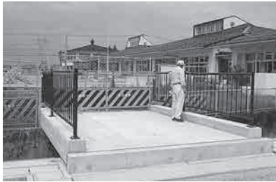
宮川こども園と新駐車場とを結ぶ橋