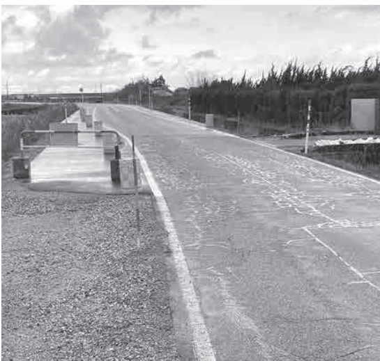
拡幅された道路(県道滑川上市線(石仏地内))