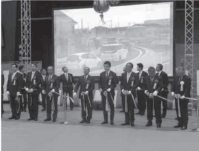
上市スマート IC 開通式(式典会場：宮川小学校体育館)