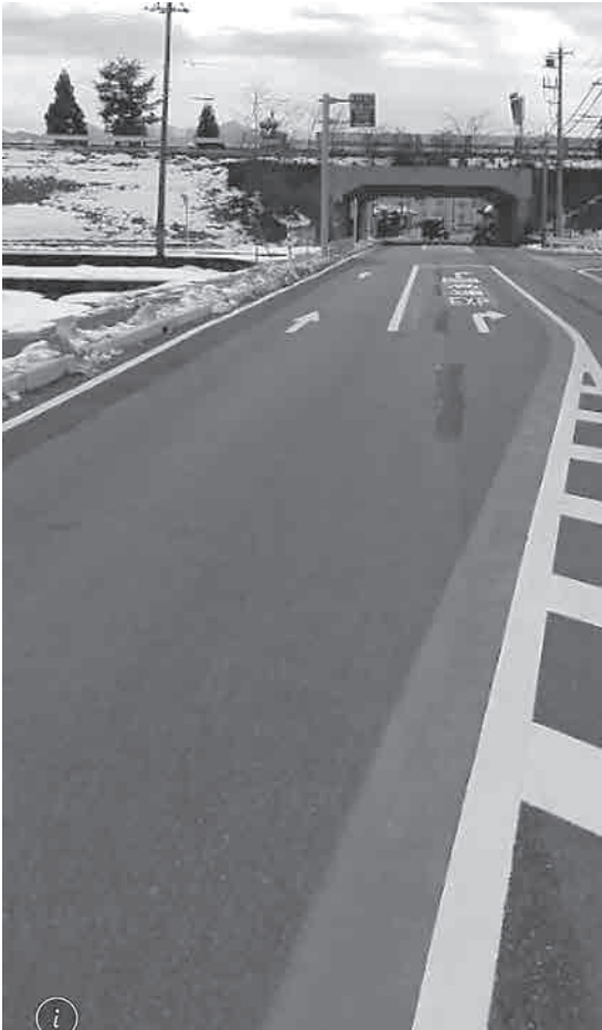
上市スマートIC出入口との接続道路