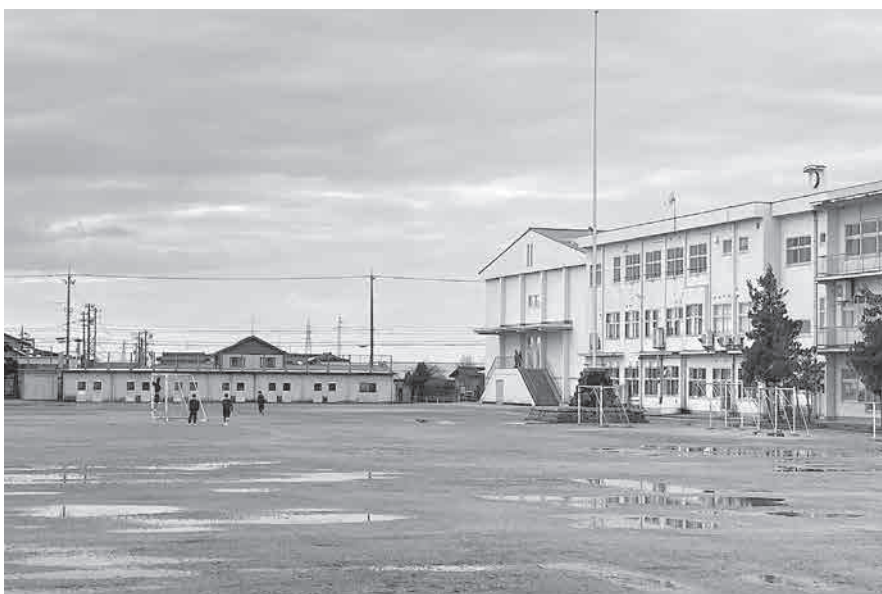
上市中学校の外観