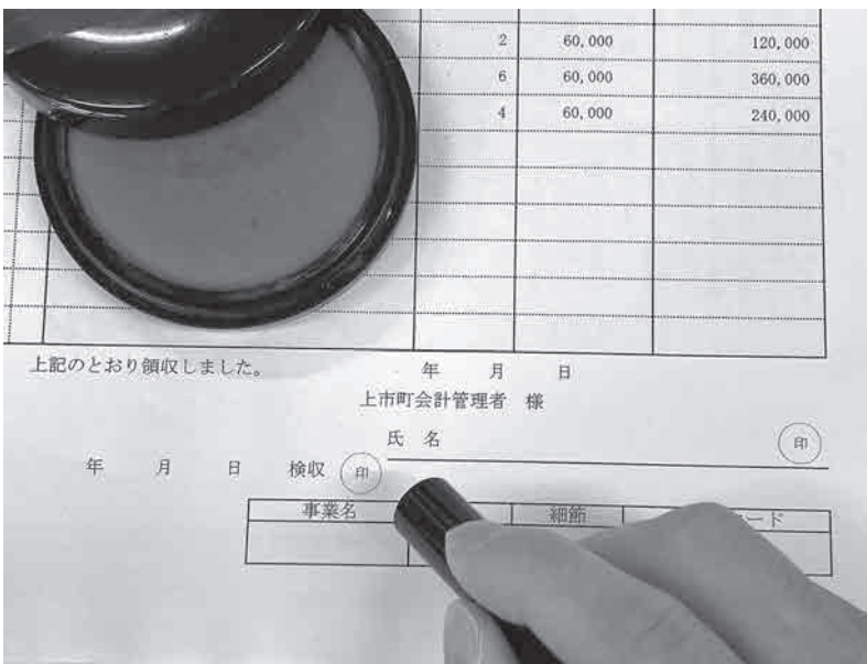
押印が必要な町の請求書