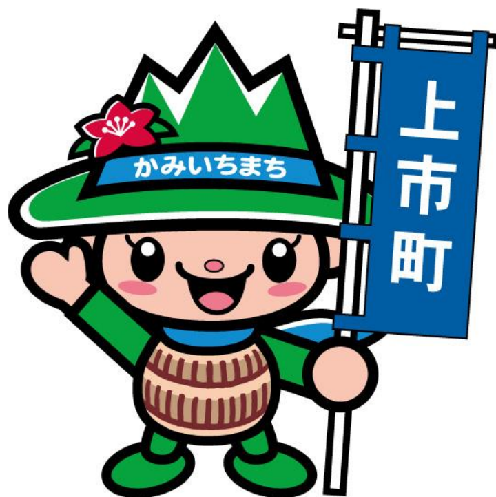
上市町マスコットキャラクター「つるぎくん」