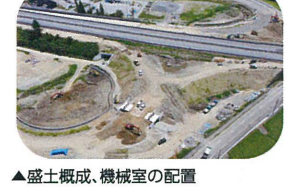
▲盛土概成、機械室の配置