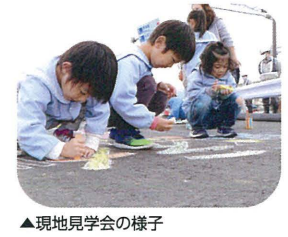
▲現地見学会の様子