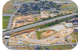
▲盛土概成、設備に着手