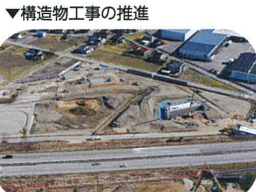
▼構造物工事の推進