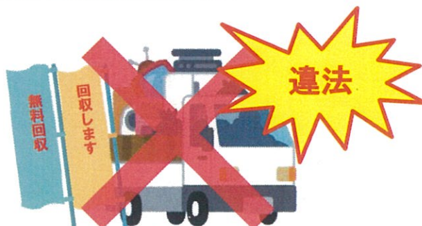
解体業者、不要品回収業者等（一般廃棄物処理業の許可なし）が回収