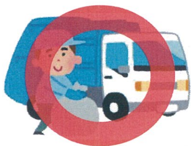
市町村の指定する方法