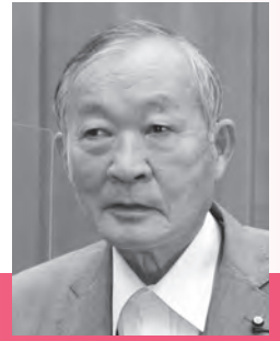
碓井 憲夫 議員