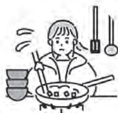
色々な家事をしている