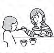
障害や病気の家族の世話