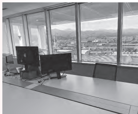
とみしん上市サテライトオフィス

しかし、令和4年3月に開催したeスポーツ大会では入居企業のNTT西日本の協力のもとサテライトオフィスをメイン会場として提供して頂いた。また、町内事業者と上市への進出を検討している企業とのワークショップ開催などに「とみしん上市サテライトオフィス」を活用させて頂き、地域との交流を積極的に進めていく。