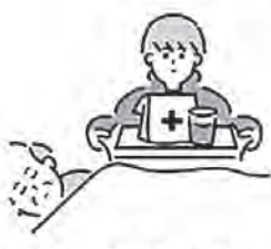
家族の看病をしている