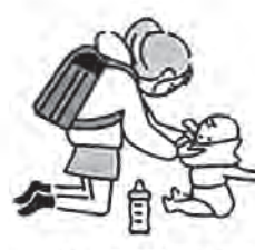
幼い兄弟姉妹の世話