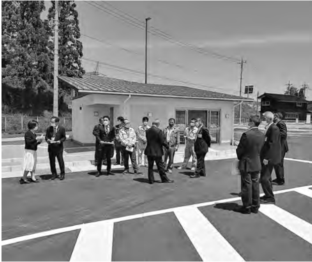
上市スマートインター待合室

新潟間のみ高速バスが運行している。高速バス停供用開始記念事業で、上市・新潟間高速バス運賃半額キャンペーンを、令和4年5月25日から開始している。多くの町民の皆様が上市スマートインターチェンジと高速バス停を利用して頂き、今後は東京便も上市バス停に停まってもらえるよう働きかけて参ります。(椎名寛子)