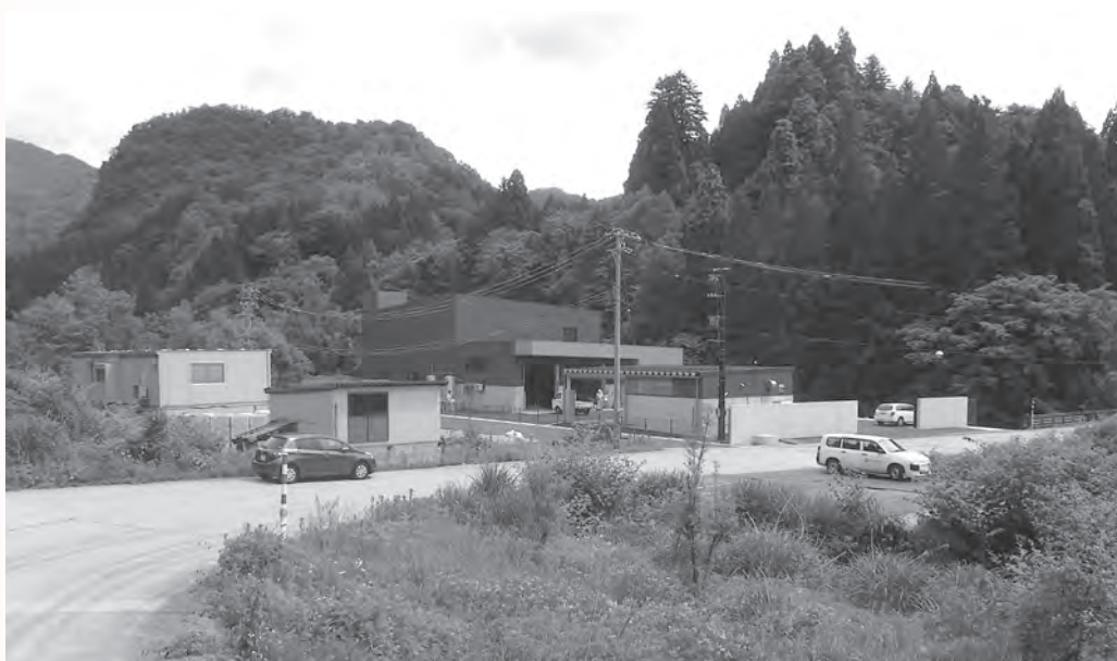
富山地区広域圏事務組合有害鳥獣焼却施設（立山町小又地内）