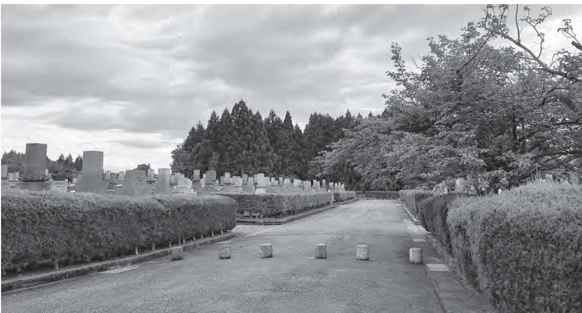
整備された墓地公園