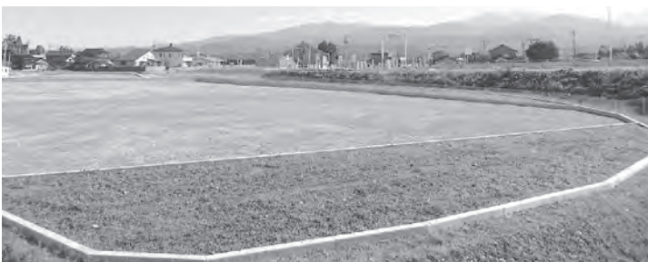
スマート IC 宮川地域工業団地

係区長等役員の方々への説明会を開催したところ、現地の事情に詳しい方々を中心に地元連絡協議会を立ち上げていただき、その組織を窓口として協議していくことになった。 今後、地元との対話を重ね、本事業を着実に進展していきたいと考えている。