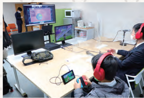
▲eスポーツ大会の様子