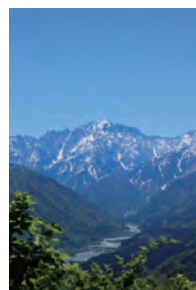
▲千石城山からの剣岳