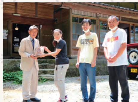
▲おおかみこどもの花の家 10万人目の来場者