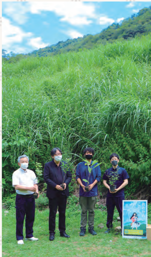
▲「おおかみこどもの森づくり」プロジェクト