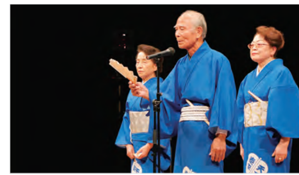
▲ステージ発表(相撲甚句)

11月19日、20日の2日間、北アルプス文化センターで「フレアールかみいちフェスティバル」が開催されました。働く婦人の家で開講されている各講座で、「自分らしく輝こう!」をモットーに学ぶ皆さんが制作した作品展示やステージ発表などが行われ、多くの来場者で賑わいました。