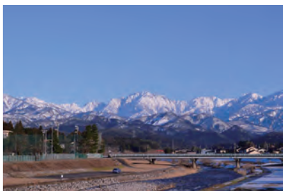
▲上市川土手からの剣岳