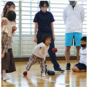
▲さんさんスポーツフェスタ