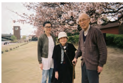
▲大好きな祖父母とお出かけ