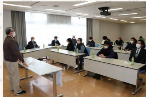
▲農業学舎発会総会