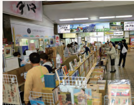
▲上市えきなか古本市