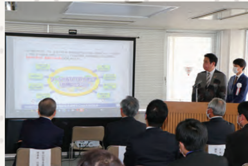
▲とみしん上市サテライトオフィス完成披露会