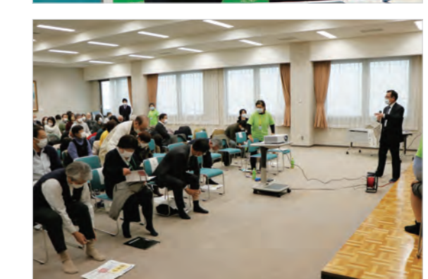
▲指輪っかテストに取り組む参加者