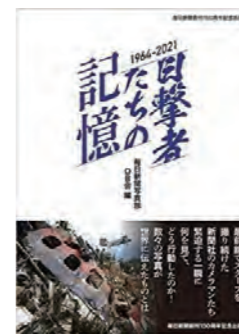
『目撃者たちの記憶』 毎日新聞写真部 OB会 / 著 大空出版 / 発行

よく目にするスクープ報道。その裏側では、何が起っていたのか。緊迫する取材現場で撮り続けた毎日新聞社のカメラマンたちが、何を見て感じ、どのようにしてスクープ写真を撮影したのか。東京五輪、あさま山荘事件、日航ジャンボ機墜落事故、雲仙普賢岳火砕流災害、東日本大震災…。1964年から2021年まで、数々の写真とともに綴った毎日新聞の写真部史。