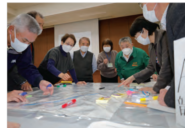
▲地図に書き込みながら議論する参加者

この研修会は、風水害などに備え、避難経路や避難者の誘導方法などを考えておくことを目的に町社会福祉協議会と町ボランティアセンターが開きました。この日、大きな地図を囲み、被災・避難することを想定し議論する「災害図上訓練」に取り組んだ参加者は、防災・減災の重要性を改めて感じたのではないのでしょうか。