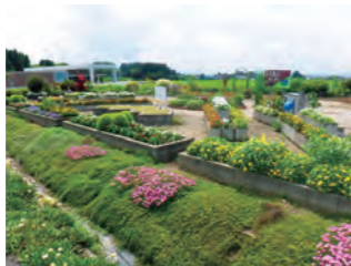
▲同支店が整備している花壇ふれあいガーデン（湯上野）

花と緑の銀行上市支店は、「花と緑のまちづくり」を推進することを目的として活動しています。会員の一人として、地域の緑化推進のために一緒に活動しませんか。興味のある方は、産業課農林整備班までお気軽にご相談ください。