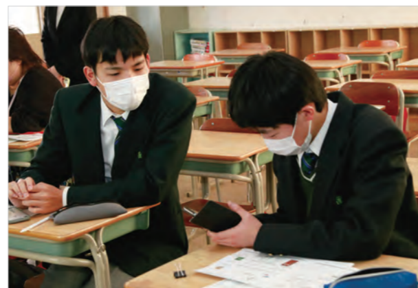
▲学んだことを実践する様子

この研修では、デジタルデバインド(情報格差)を解消するため、スマートフォンに不慣れな高齢者などを地域で継続して支える活動を行う「スマホサポーター」を養成します。生徒たちは、できるだけ平易な表現で教えるなどのポイントを学び、お互いに実践形式で「メールの送り方」などを教え合いました。今後、生徒らは「スマホサポーター」として活動に取組む予定です。