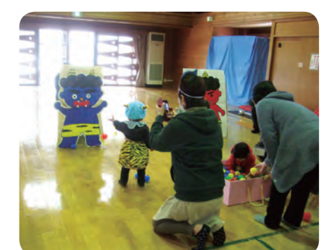
▲昨年の合同まめまき会の様子