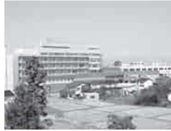
かみいち総合病院

町長 かみいち総合病院の新病院の建設。下水道事業の整備。保健福祉総合センターの整備を実施し、「アルプスの湯」を運営。町営住宅を陽南小・白萩西部小校区に建設。小中学校等の耐震化や老朽化対策に取り組んだ。