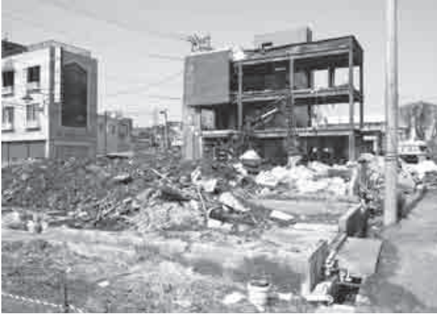
復旧が進む糸魚川大火跡地

育む事を一番の狙いとしており、各校、創意工夫を凝らし、安全教育に取り組んでいる。今後は、家庭や地域の関係機関・団体等と密接に連携し、安全教育の一層の充実をめたい。