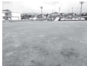
南加積小学校グラウンド

議員 公共施設の緞帳(落下)、グラウンド改修予定年次を伺う。 教育長 緞帳、設置後30年経過。今後全ての学校において安全点検項目へ追加。各グラウンドは年