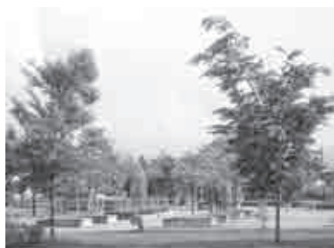
あさひの郷(さと)公園