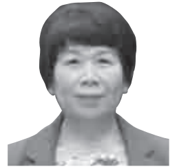
平井 妙子 議員