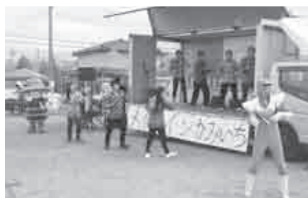
メイドインかみいち（弓庄公園）

今後上市町の活性化につながる催しは、町の後援・PRで後押ししたい。町在住者による新たな催しの町内開催についても、積極的な支援を検討し、環境整備に努める。