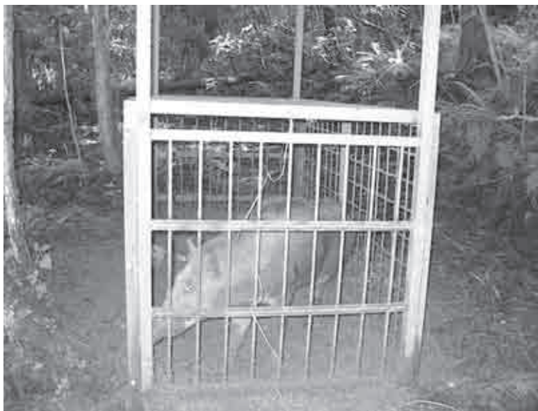
捕獲檻に入ったイノシシ

議員 地域交通計画策定を伺う。路線見直し、増車、バス停等。 町長 計画は地域にとって望ましい姿を明らかにするマスタープランであり、地方公共団体、交通事業者、利用者等の関係者との協議の上で策定バス路線の見直しにより国庫補助対象路線となり、補助金の上限額算定で優遇措置が受けられる。関係機関との連携を推進する。