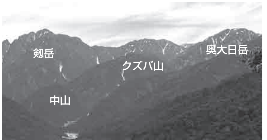
望まれる周遊コース

足の状況が有り、周辺の空き地を利用した駐車場確保が必要。また、町の空き店舗対策事業費補助金制度活用で、女性や若者が起業しやすい環境整備を図って参りたい。