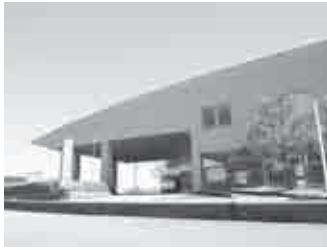
保健福祉総合センター

町長 かみいち総合病院の新病院の建設。下水道事業の整備。保健福祉総合センターの整備を実施し、「アルプスの湯」を運営。町営住宅を陽南小・白萩西部小校区に建設。小中学校等の耐震化や老朽化対策に取り組んだ。