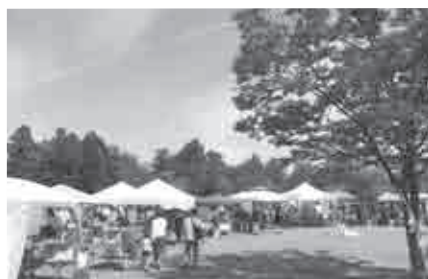
立山クラフト（立山町総合公園）