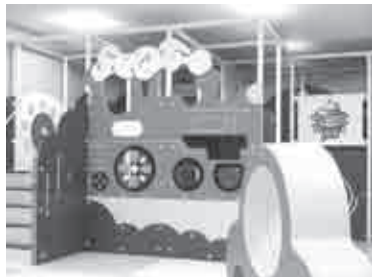
カミール2階の大型遊具

従来から同所で実施している子育て支援教室や子育て相談窓口とあいまって、施設の魅力が町内外にも知られてきた。休日の相談窓口開設時間帯には、30組程度の親子が訪れている。