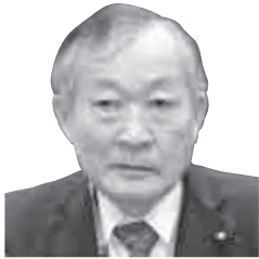
碓井 憲夫 議員