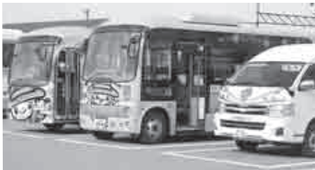
上市駅前に停車中のコミュニティバス

積雪時の冬場に、不便を 感じる傾向あり。バスの 運行路線の見直しは年度 ごとに行っているが、従 来の経路上でバス停留所 の位置変更を、といった ことであれば年度半ばで も柔軟に対応されたい。