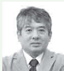
町観光協会事務局長