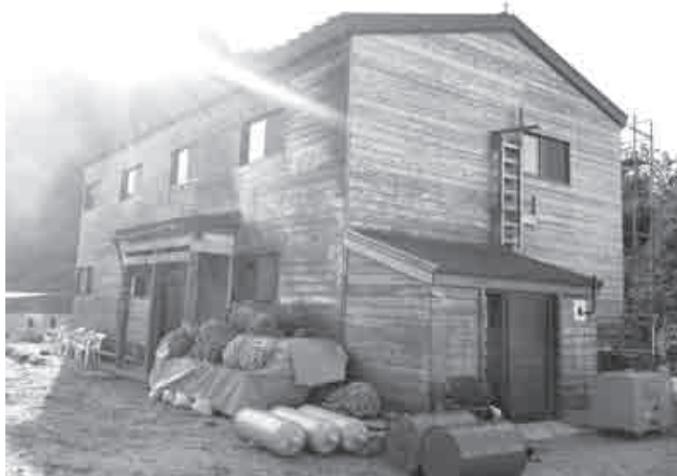
早月尾根 早月小屋

町長 山岳トイレは、山岳地域の自然環境の保全を図るとともに、登山者に快適な利用環境を提供する上で非常に重要な施設である。現在、剣岳早月尾根ルートトイレ