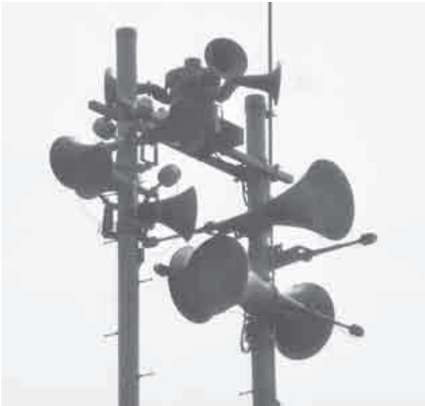
サイレン吹鳴装置

なお、現在、サイレン吹鳴の要望が多いことから無線以外の方式で、以前のように全地区のサイレンを遠隔吹鳴させるための新たなシステムを、関係機関を含め、協議・検討している。