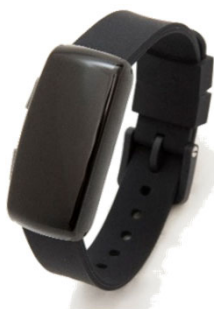
◀ウェアラブル端末