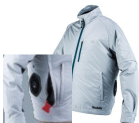
▲ファン付きウェア