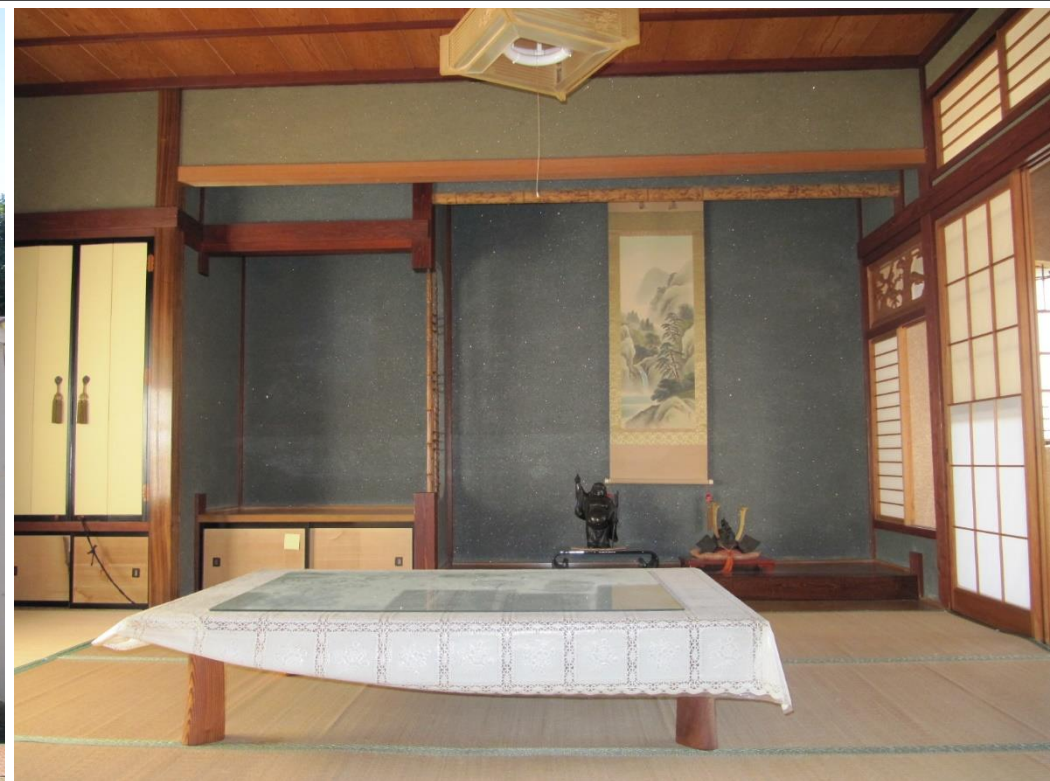
・空き家の内観(書院造の和室)