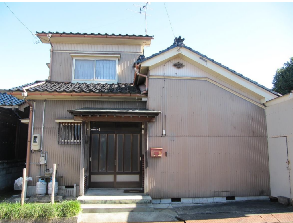
・空き家の外観(北東側)、延床面積:168㎡