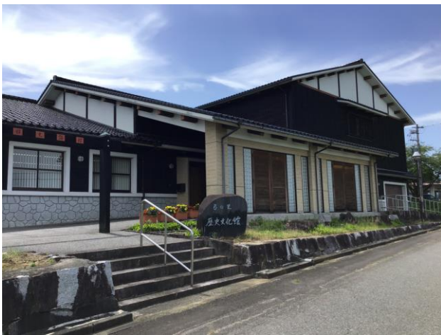
弓の里歴史文化館