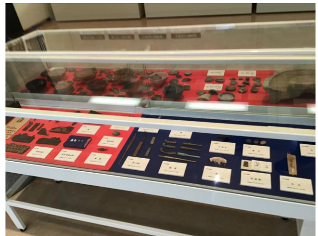
弓庄城からの出土品