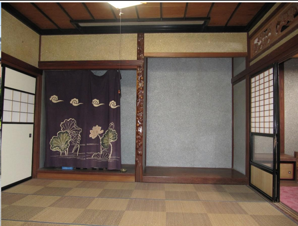
・空き家の内観(真壁造りの1階和室)