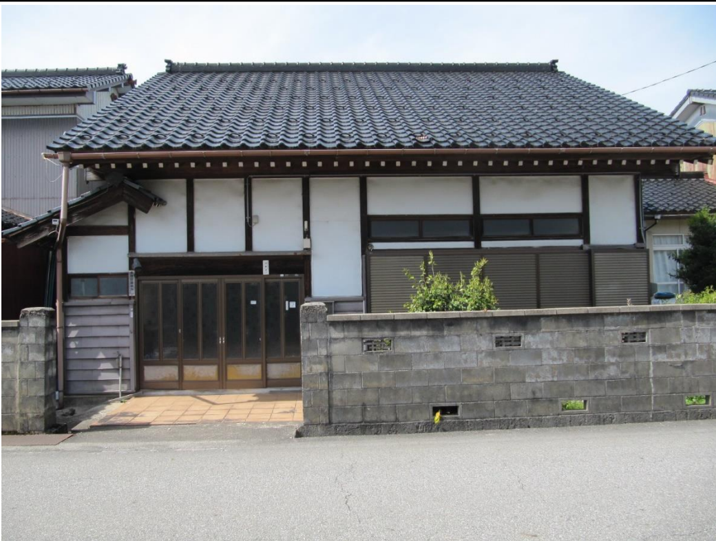
・空き家の外観(南側)