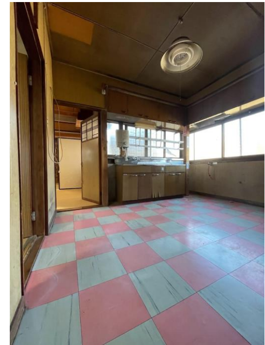
⑥1階ダイニング、キッチン