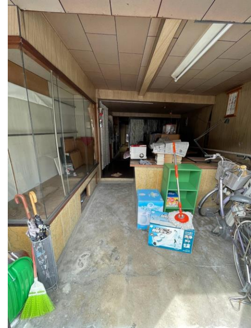
③1階旧店舗スペース