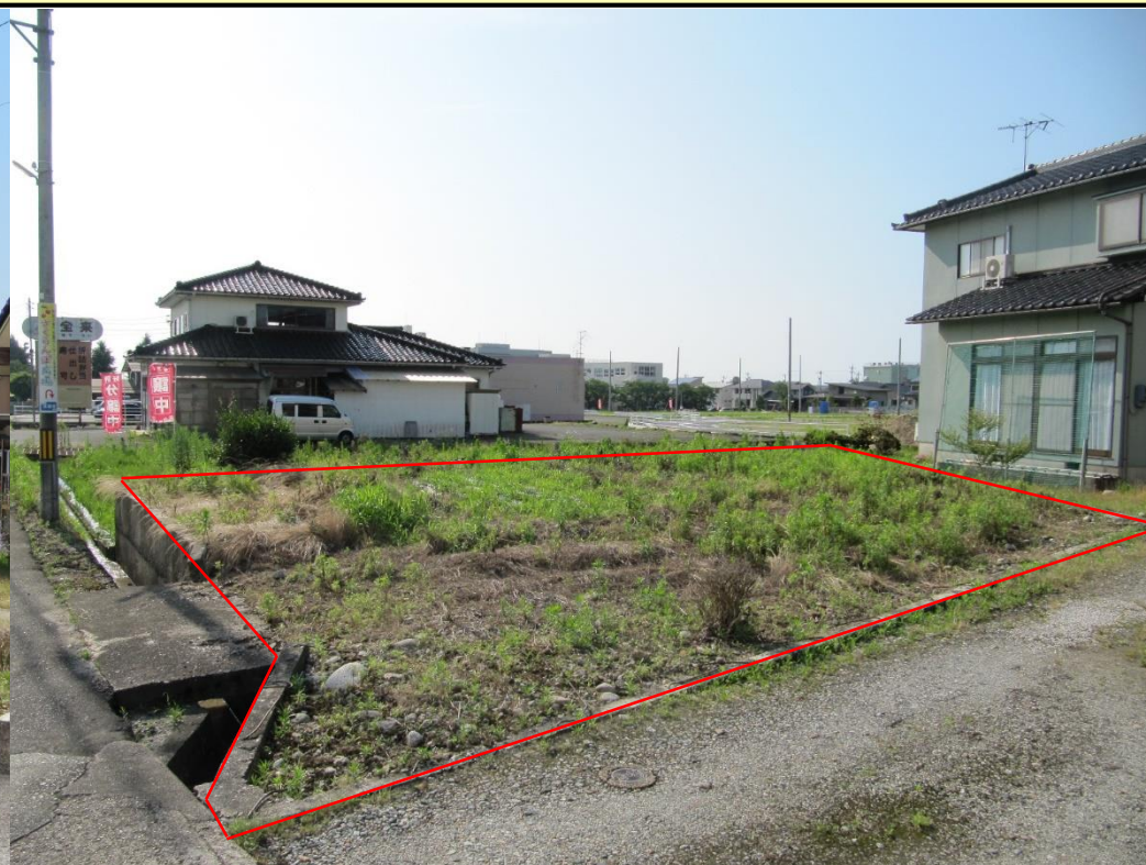
・空き地(南東側): 赤い線の枠内