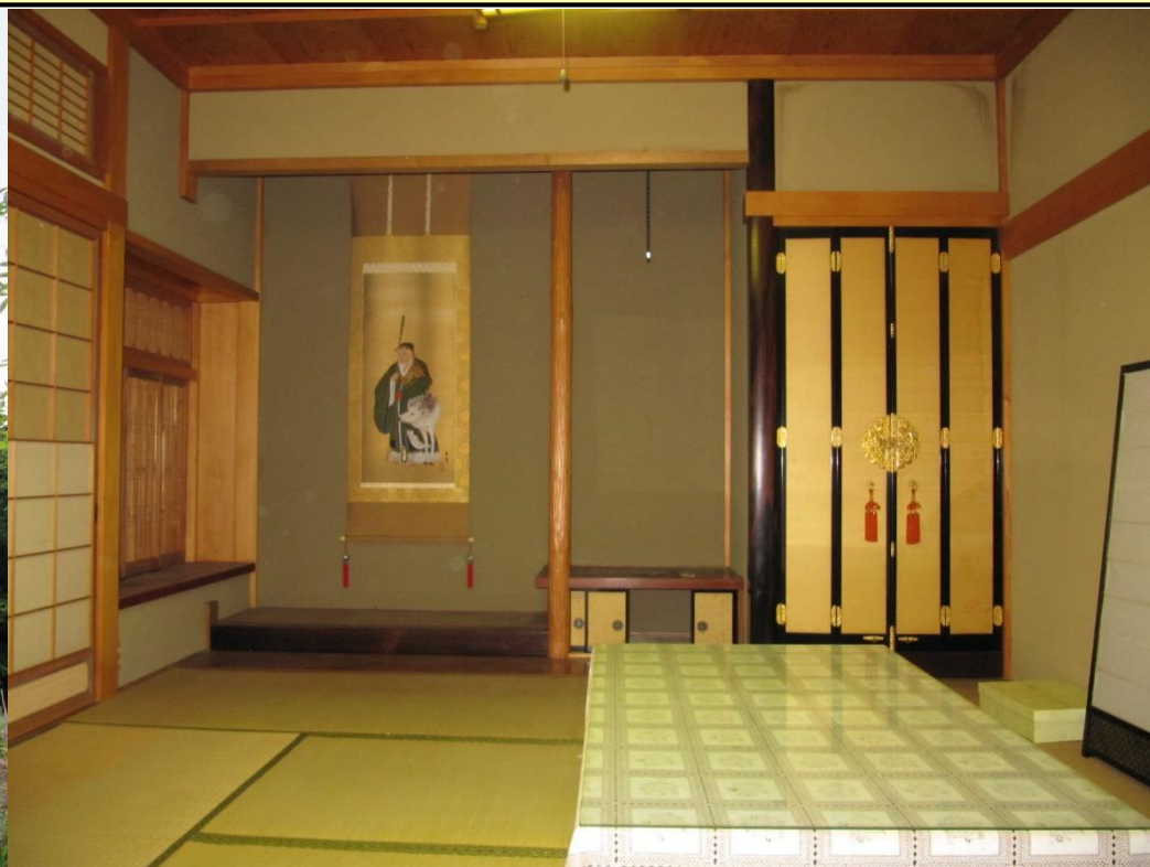
・空き家の内観(書院造りの1階和室)