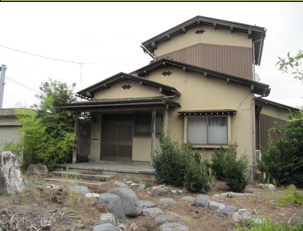
・空き家の外観(南西側)