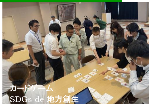
カードゲーム SDGs de 地方創生

他課からの企画提案に自課のスキルを掛け合わせることでさらに改善できないか等を検討し、実施可能な事業を推進本部へ提案する。