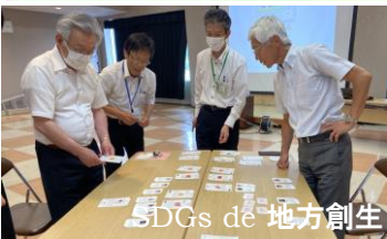
SDGs de 地方創生