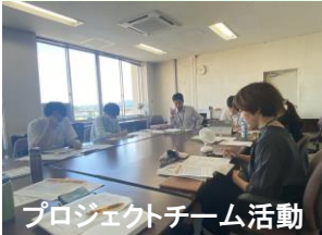
プロジェクトチーム活動