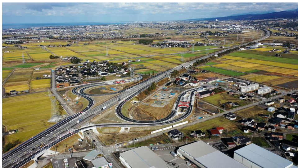
上市スマートインターチェンジ

大都市圏への若い世代の流出に歯止めをかけるために、デジタル技術の活用による雇用の創出や地域活性化を図るとともに、ひと・もの・しごとの流れを生むための基盤を整えて、上市町の長を最大限に活かし、特産品開発や農業の担い手育成、移住・定住の促進を図るなど、にぎわうまちづくりに向けた取組にチャレンジします。