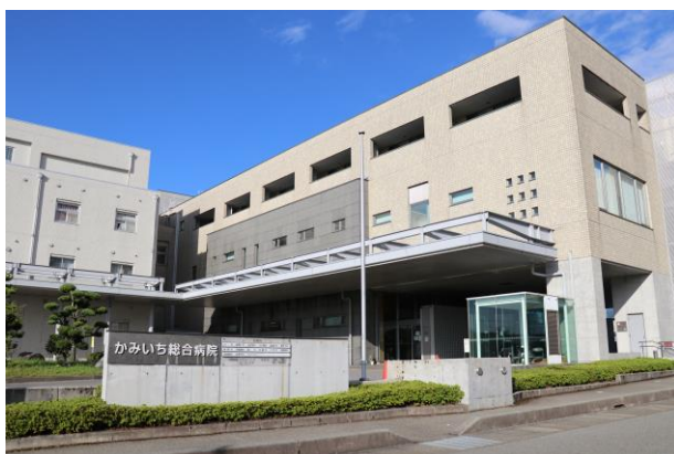
かみいち 総合病院