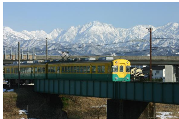
かぼちゃ電車と剱岳