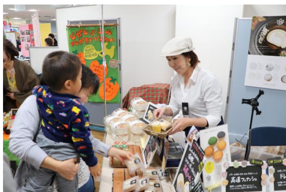
創業支援チャレンジショップ事業