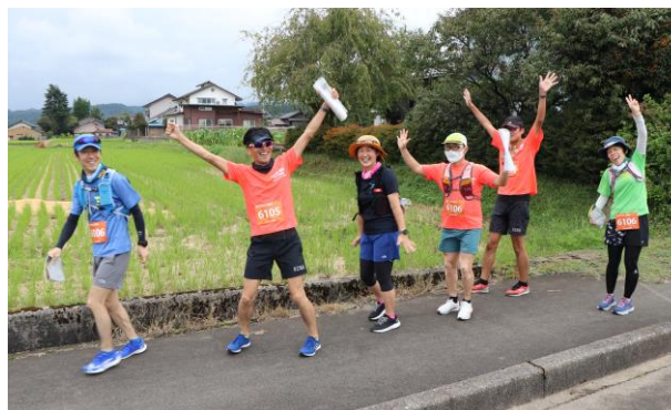
フォトログейニング