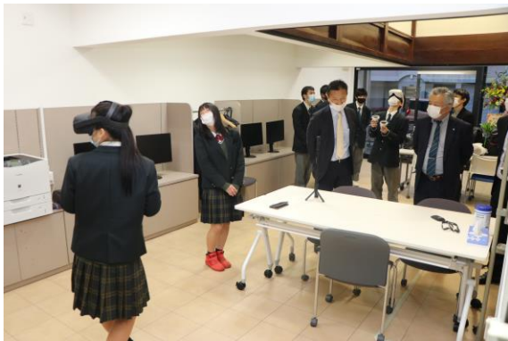
サテライトオフィスでのバーチャル技術体験