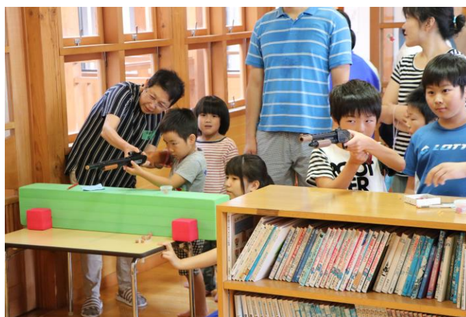
こどもの城・城まつり

人口減少や少子化、核家族化といった状況が見られるなか、子育て家庭の不安や負担感を軽減する取組を充実させ、希望通りの結婚ができ、妊娠・出産・子育てと切れ目なく支援するほか、学校、各種団体とも連携しながら教育環境の充実を図るなど、ミライへつながる人づくりを推進します。