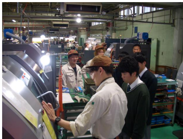
上市高校生の職場見学会