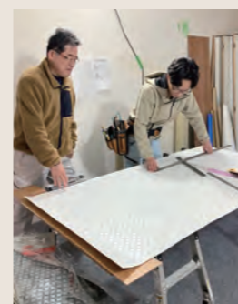
技能グランプリ(壁装部門)に出場する選手を指導する奥さん(左)。

「自分は良い人との出会いがあり、支援してくれた方々のおかげでこれまで仕事を続けてこられた、受賞しても驕ることなく精進していきたい」と謙虚な姿勢を見せる奥さん。専門的な技術や知識は日々進化している内装業。奥さんは、常に新しい技術や内装素材の知識の習得をいとわないことで専門家としての成長を実感できるといいます。この仕事を目指したきっかけは、学生時代のアルバイトで、とてもきれいにクロスなどを貼る職人の技術を目の当たりにしたことでした。「頑固で一度始めたことは最後までやり通す職人丸出しの性格」という奥さん。技能の習得レベルを評価する国家検定制度「技能検定」で壁装作業や内装仕上げ施工の1級技能士を取得し、幅広い知識・技能で仕事に妥協は許しません。自身は約20年前に技能グランプリに出場し敢闘賞を受賞したことも。80代で現役を続ける同僚を目標に健康管理を徹底して、「生涯現役を続けたい」と話します。