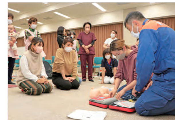
▲上市消防署員によるAEDの実技指導の様子

教室では、救急対応の目安を提供してくれるウェブサイトなどを活用した適切な対応や受診が呼びかけられたほか、心臓マッサージや自動体外式除細動器（AED）の使い方や誤飲時の対応方法の実技指導も行われました。