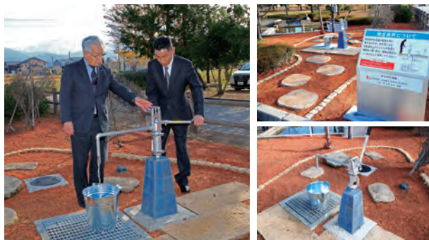
▲中川町長（左）と土肥社長（右）

同社の技術を活かし設置されたこの設備は、公園内の「せせらぎ水路」への水を供給する電動ポンプと災害時に手で給水できるポンプを備えています。