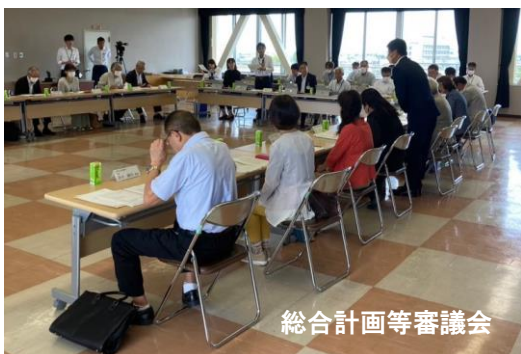
総合計画等審議会