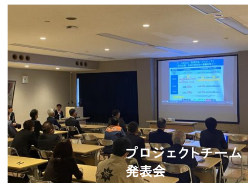
プロジェクトチーム 発表会