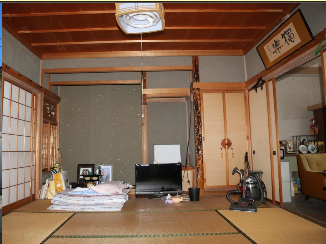
・空き家の内観(1階和室)