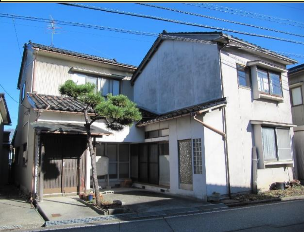
・空き家の外観(西側)